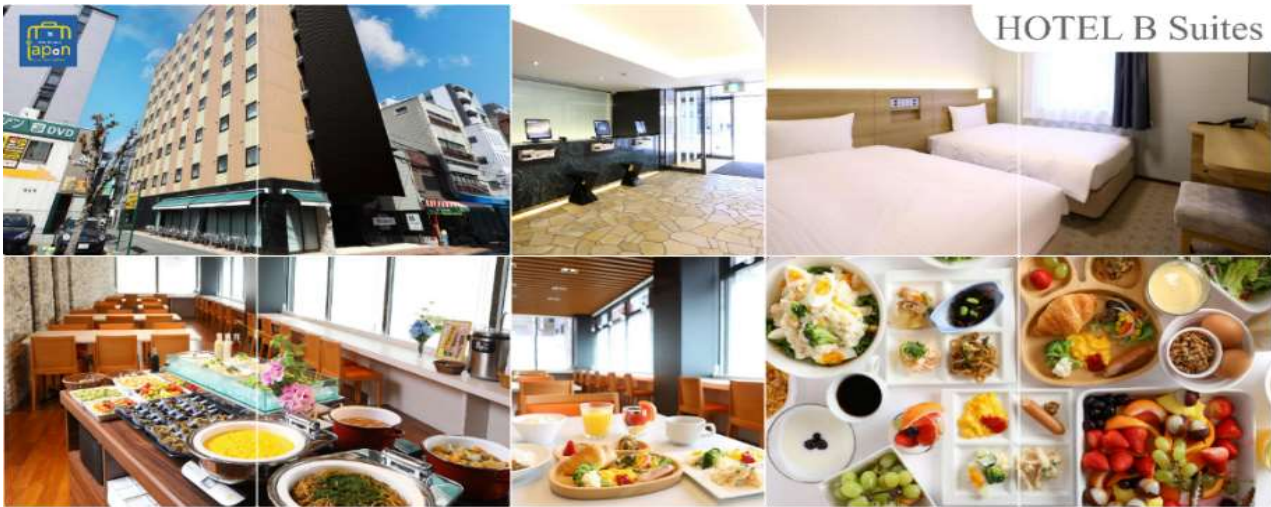
HOTEL B Suites

HOTEL B SUITES NAMBA, OSAKA หรือเทียบเท่าระดับเดียวกัน