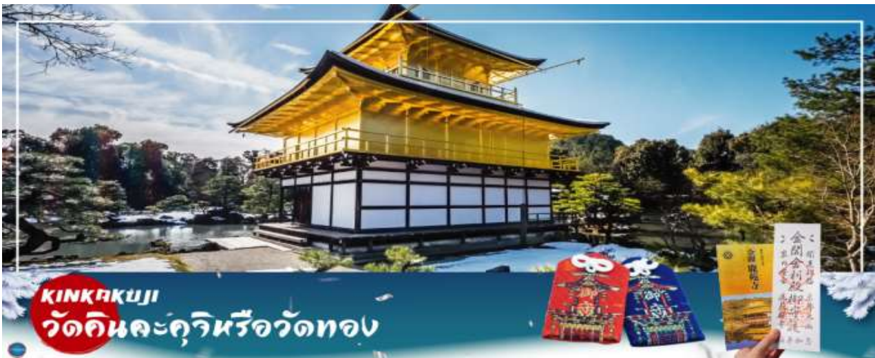
KINKAKUJI วัดคินคะคุจิหรือวัดทอง

เมืองโอซาก้า - เมืองเกียวโต - วัดคินคะคุจิ - การเรียนพิธีชงชาญี่ปุ่น - วัดคิโยมิตสึเดระ - ย่านอิกาชิยาม่า - เมืองโอซาก้า - ช้อปปิ้งชินไซบาชิ