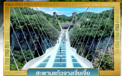
สะพานแก้วจางเจียเจีย