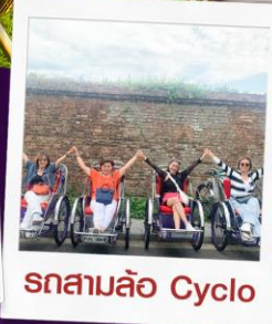
รถสามล้อ Cyclo