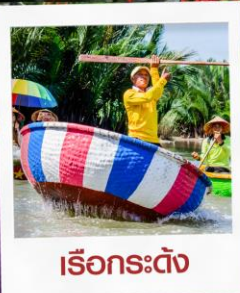
เรือกระดัง