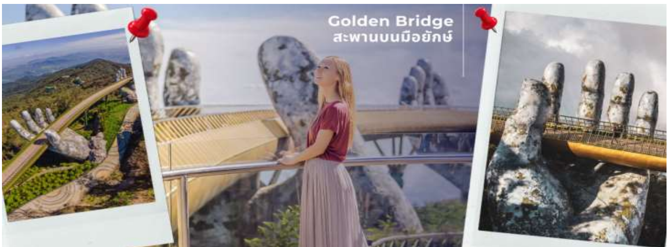
Golden Bridge สะพานบนมือยักษ์

ก่อนลงจากยอดเขา บานาฮิลล์ นำท่านชม Golden Bridge หรือ สะพานบนมือยักษ์ หรือ สะพานลอยฟ้า ที่ บานาฮิลล์ ดานัง ประเทศเวียดนาม นั่นเอง ที่นั่นนอกจากจะกลายเป็นแหล่งท่องเที่ยวที่นักท่องเที่ยวจะพลาดไม่ได้เมื่อมาถึงเมืองดานังแล้ว ยังเป็นแลนด์มาร์ค จุดถ่ายรูปสวยๆ ของเวียดนาม ที่หลายคนอยากจะทำถ่ายรูปไว้ๆ กันตรงนี้สักครั้ง