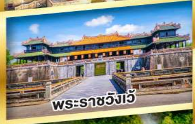
พระราชวังเว็