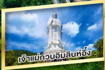
เจ้าแม่กวนอิมลีนห่อ้ง

พัก บานาฮิลล์ 1 คืน, ดานัง 1 คืน, เว็ 1 คืน