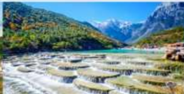
ทะเลสาบไป๋สุ่ยเหอ