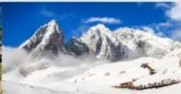
ภูเขาหิมะมิงกรหยก