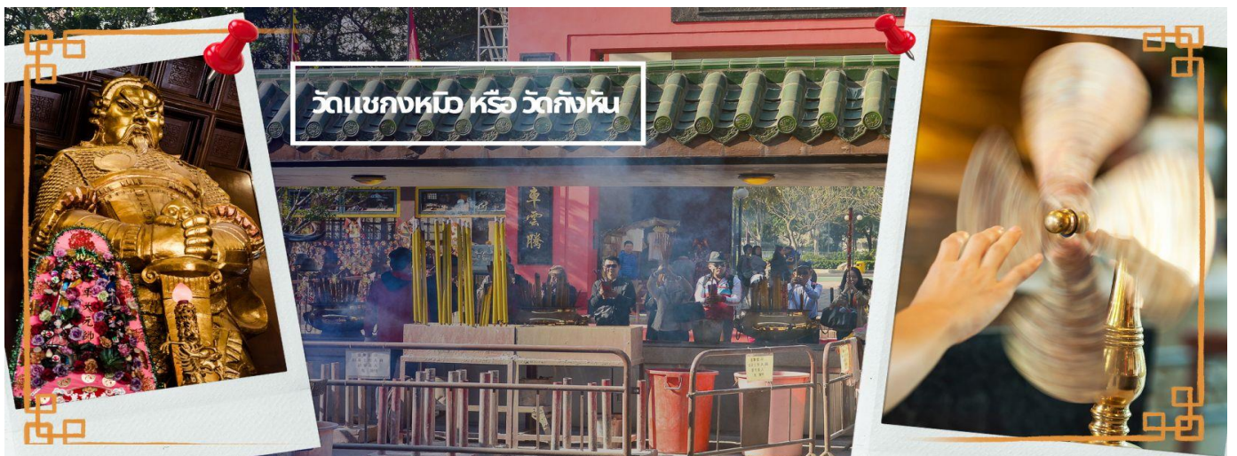
วัดเขangkงหมิว หรือ วัดก้งหัน

จากนั้นนำท่านเดินทางไป วัดเขangkงหมิว หรือ วัดก้งหัน (CHE KUNG TEMPLE) วัดแห่งสร้างขึ้นเพื่อเป็นอนุสรณ์เพื่อรำลึกถึงตำนานแห่งนักรบราชวงศ์ซ่ง มีนามว่า “แซ กง” แม่ทัพปราบศึก ผู้คนทั่วทุกดินแดนต่างยำเกรงในกำลังพลอันกล้าหาญแข็งแกร่งของแม่ทัพแซกง เป็นวัดเก่าแก่ที่มีความศักดิ์สิทธิ์มาก มีอายุกว่า 300 ปีตั้งอยู่ในเขต SHATIN มีประวัติเล่าต่อกันมาว่า ขณะที่แม่ทัพปราบศึกอยู่นั้น ทุกแคว้นเขตแดนแผ่นดินใหญ่ ต่างก็ยำเกรงต่อกำลังพลที่กล้าหาญในกองทัพของท่าน ยามที่ออกรบเพื่อต้านข้าศึกศัตรูทุกทิศทาง ทุก ๆ ครั้ง ท่านใช้สัญลักษณ์รูปก้งหัน 4 ใบพัดติดไว้ด้านหลังรถศึกนำ ขบวนในกองทัพ เหล่าทหารกล้ามีความเชื่อว่าเมื่อพก พาสัญลักษณ์รูปก้งหันนี้ไป ณ ที่ใด ๆ ก้งหันนี้จะช่วยเสริมสิริมงคล นำพาแต่ความโชคดี มีอำนาจเข้มแข็ง เสริมกำลังใจให้แก่กองทัพของท่าน ชื่อเสียงในการนำทัพสู้ศึกของท่านจึงเป็นตำนานมาจนทุกวันนี้ ปัจจุบันวัดแซกง จึงเป็นสถานที่สักการะเคารพ ขอพร ท่านแซกง โดยมีสัญลักษณ์เป็นก้งหันนำโชคนั่นเอง 🕒 การหมนก้งหันนำโชคที่ตั้งอยู่ในวัด เพื่อจะได้หมนเวียนชีวิตของเราและครอบครัวให้มีความเจริญก้าวหน้าด้านหน้าที่การงาน โชคลาภ ยศศักดิ์ และถ้าหากคนที่ดวงไม่มีมีเคราะห์ร้ายก็ถือว่าเป็นการช่วยหมนปัดเป่าเอาสิ่งร้ายและไม่ดีออกไปให้หมด ในองค์ก้งหันนำโชคมี 4 ใบพัด คือพร 4 ประการ ได้แก่ สุขภาพร่างกายแข็งแรง, สมความปรารถนา และเงินทองไหลมาเทมา ในทุกๆวันที่ 2 ของเดือนแรกตามปฏิทินจีน ชาวฮ่องกงและนักธุรกิจจะมาวัดนี้เพื่อถวายก้งหันลมเพราะเชื่อว่าก้งหันจะช่วยพัดพาสิ่งชั่วร้ายและโรคภัยไข้เจ็บออกไปจากตัวและนำพาแต่ความโชคดีเข้ามาแทน