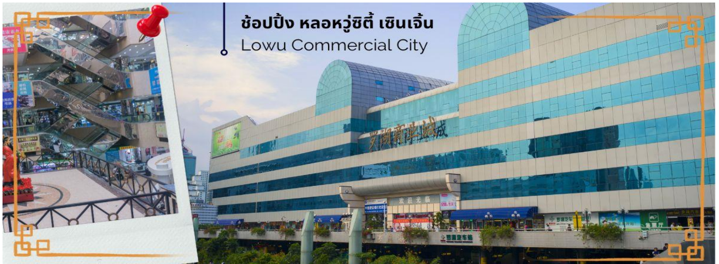
ช้อปปิ้ง หอหู่ซี้ตี้ เซินเจิ้น Lowu Commercial City

จากนั้นนำท่านเที่ยวชม บ้านหิมะ (Window of the World Alps Ice and Snow World) ให้ทุกท่านได้สัมผัสกับอากาศหนาว พร้อมได้ถ่ายรูปในมุมน่ารักๆ ในบรรยากาศที่เต็มไปด้วยหิมะขาวๆ (ไม่รวมค่าเครื่องเล่นและอุปกรณ์สกี) จากนั้นนำท่านอิสระช้อปปิ้ง หอหู่ซี้ตี้ เซินเจิ้น หอหู่ซี้ตี้คือแหล่งช้อปปิ้งชื่อดังของเมืองเซินเจิ้น ที่มีสินค้าพื้นเมืองและสินค้าเลียนแบบแบรนด์เนมมากมายหลายชนิดหลายยี่ห้อ ให้ท่านได้เลือกซื้อในราคาไม่แพง ทั้งกระเป๋า รองเท้า นาฬิกา เครื่องใช้ไฟฟ้า ปากกา เครื่องประดับ อุปกรณ์อิเล็กทรอนิกส์ต่างๆ ซึ่งนักท่องเที่ยวที่มาช้อปปิ้งที่นี่สามารถ