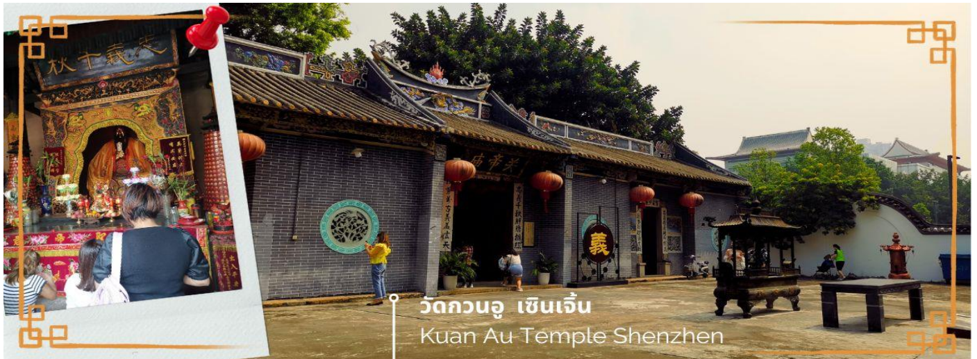
วัดกวนอู เซินเจิ้น Kuan Au Temple Shenzhen

จากนั้นนำท่านเดินทางสู่ วัดกวนอู ไหว้เทพเจ้ากวนอู สัญลักษณ์ของความซื่อสัตย์ ความกตัญญูรู้คุณ ความจงรักภักดี ความกล้าหาญ โขศลาภ และบารมี ท่านเปรียบเสมือนตัวแทนของความเข้มแข็งเด็ดเดี่ยวของอาจไม่ครั้งครั้นต่อศัตรู ท่านเป็นคนจิตใจมั่นคงตั้งขุนเขา มีสติปัญญาเฉลียวฉลาด และไม่เคยประมาทการบูชาขอพรท่านก็หมายถึงขอให้ท่านช่วยอุดช่องว่างไม่ให้เพลิงพล้ำแก่ฝ่ายตรงข้าม และให้เกิดความสมบูรณ์ด้วยคนข้างเคียงที่ซื่อสัตย์ หรือบาริวรที่ไว้วางใจได้นั้นเองดังนั้นประชาชนคนจีนจึงนิยมบูชา และกราบไหว้เพื่อความเป็นสิริมงคลต่อตนเอง และครอบครัวในทุกๆ ด้าน