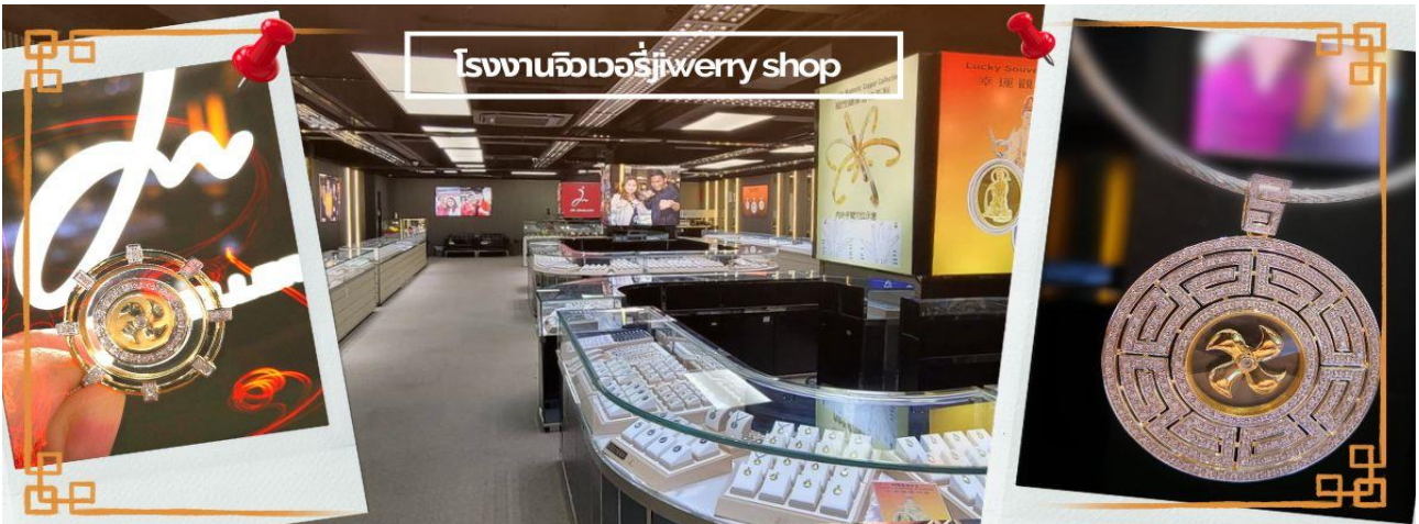
โรงงานจิวเวลรี่ jewelry shop