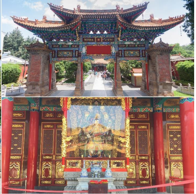
วัดหวนทอง

นำท่านชม วัดหวนทอง เป็นวัดใหญ่อันเก่าแก่ที่สุดของมณฑลยูนนาน ภายในตกแต่งร่มรื่นสวยงาม กลางลานมีสระน้ำขนาดใหญ่ สร้างมาตั้งแต่สมัยราชวงศ์ถังมีอายุยาวนานประมาณ 1,200 กว่าปี วัดหวนทองที่สร้างแปลกที่สุดในจีนคือสร้างวัดต่ำกว่าภูเขา เนื่องจากวัดแห่งนี้ไม่ได้สร้างขึ้นเพื่อเป็นวัดโดยตรงแต่เคยเป็นศาลเจ้าแม่กวนอิมมาก่อน ดังนั้นคำว่า "หวนทอง" จึงเป็นชื่อที่ปรากฏในคัมภีร์ของเจ้าแม่กวนอิม