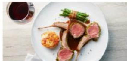
The Haven Restaurant