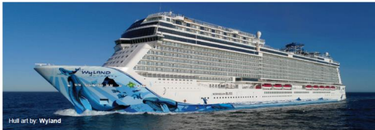
Hull art by: Wyland

Built: 2018 • Gross Tonnage: 168,028 • Guests (Double Occupancy): 4,004 • Overall Length: 1,094ft • Max Beam: 136ft • Crew: 1,716