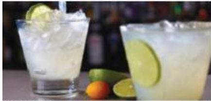
The A-List Bar

The perfect spot to sip a handcrafted cocktail and enjoy the performances from inside The Manhattan Room. Seating capacity: 20