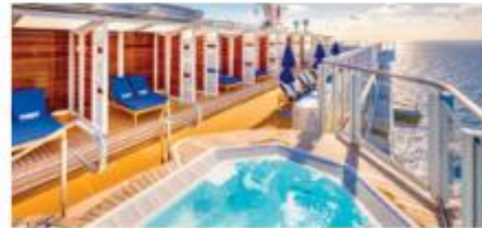
Vibe Beach Club