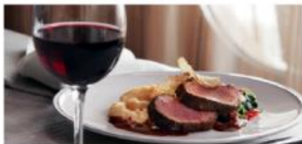
The Manhattan Room