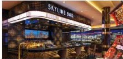
The Skyline Bar