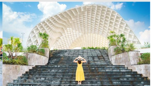
สวนเอเปค

*กรณีห้องพักบานาฮิลล์เต็ม ขอสงวนสิทธิ์ในการเปลี่ยนวันเข้าพัก และปรับเปลี่ยนโปรแกรมโดยคำนึงถึงผลประโยชน์ลูกค้าเป็นสำคัญ