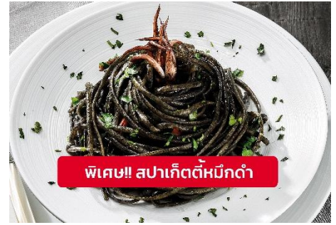
พิเศษ!! สปาเก็ตตี้หมึกดำ

Highlight! เมื่อเยือนเกาะเวนิส เมนูที่ขึ้นชื่อและหากได้มาต้องได้ลิ้มลอง สปาเก็ตตี้ผัดซอสหมึกดำที่คลุกเคล้ากับความหอมนุ่มนวลกับบรรยากาศ