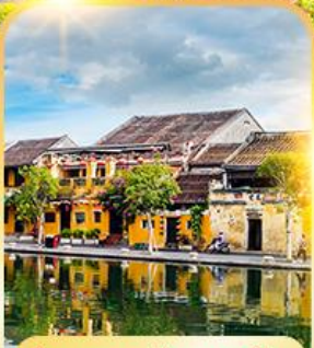
เมืองมรดกโลกฮอยอัน

ดานัง ฮอยอัน บานาฮิลล์ เที่ยวบานาฮิลล์เต็มวัน รวมบัตรเครื่องเล่น