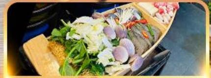
เมนูพิเศษ!! หม้อไฟพะเงา