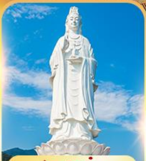
วัดหลินอิ่ง