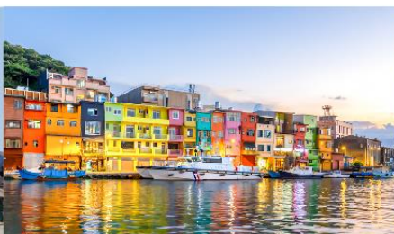
ทำเรือประมงเจิ้งปิ่น