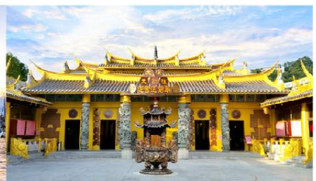
วัดเถาหยวนต้าชี่อึ้งฟู่ซ่งจง