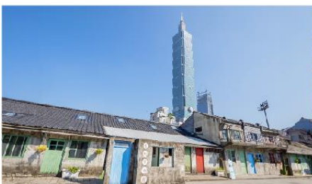
หมู่บ้านชื้อชื้อหนาน