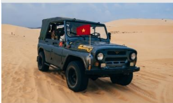
ทะเลทรายขาว