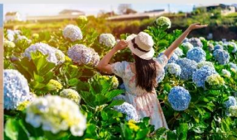
สวนดอกไฮเดรนเยีย