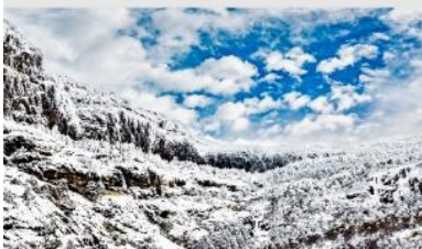
ภูเขาหิมะเจี๋ยจื่อ