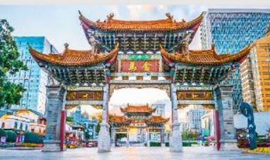
ประตูม้าทอง ไถ่หยก