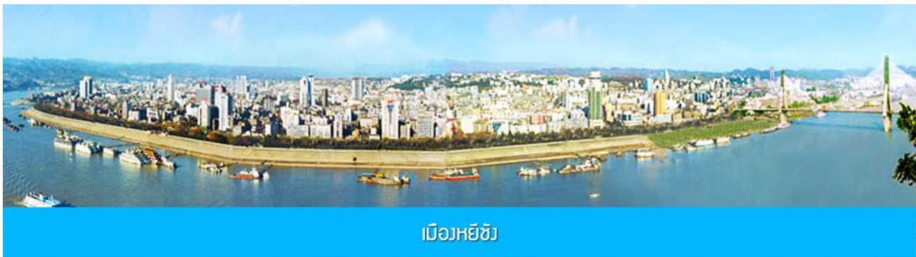
เมืองหยีซัง