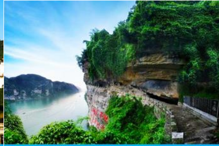
สวนถ้ำสามสหาย