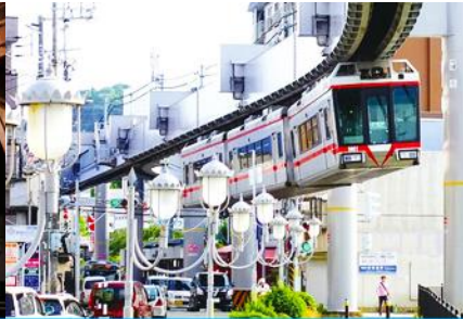
นั่งรถไฟฟ้ายางหวู่ฮั่น