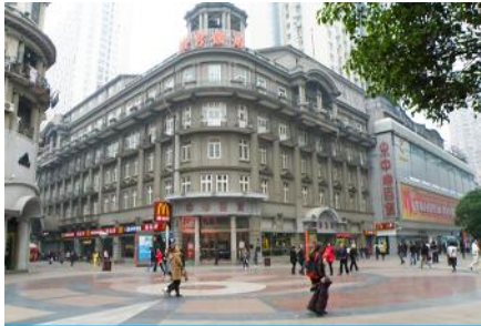
ถนนคนเดินเจียวอันลู่