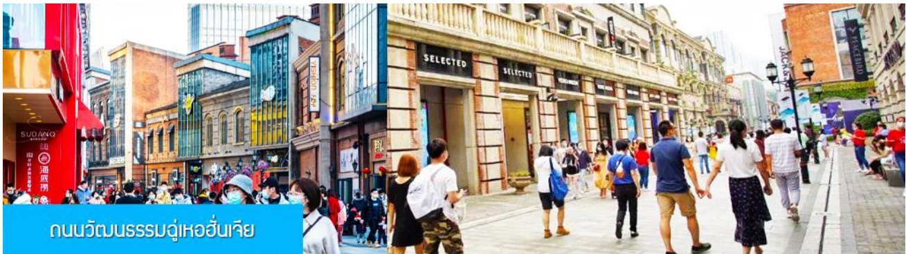
ถนนวัฒนธรรมฉู่เหออันเจีย

พักที่ WUHAN YUETING HOTEL โรงแรมระดับ 4 ดาวห้องถิ่นหรือเทียบเท่าในเมืองหวู่ฮั่น