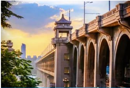
สะพานข้ามแม่น้ำหวู่ฮั่น

ไกด์ท้องถิ่นเสนอขาย โปรแกรมล่องเรือแม่น้ำแยงซีเกียง ชมความสวยงามของตึกที่ประดับประดาด้วยแสงสีใน ยามค่ำคืนของสองริมฝั่งแม่น้ำเมืองหวู่ฮั่น ค่าแพ็คเกจล่องเรือ ท่านละ 300 หยวน หรือประมาณ 1,500 บาท พักที่ WUHAN YUETING HOTEL โรงแรมระดับ 4 ดาวท้องถิ่นหรือเทียบเท่าในเมืองหวู่ฮั่น