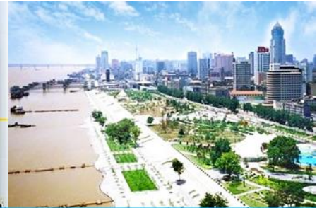
หาดฮั่นโข่วเจียงทาน