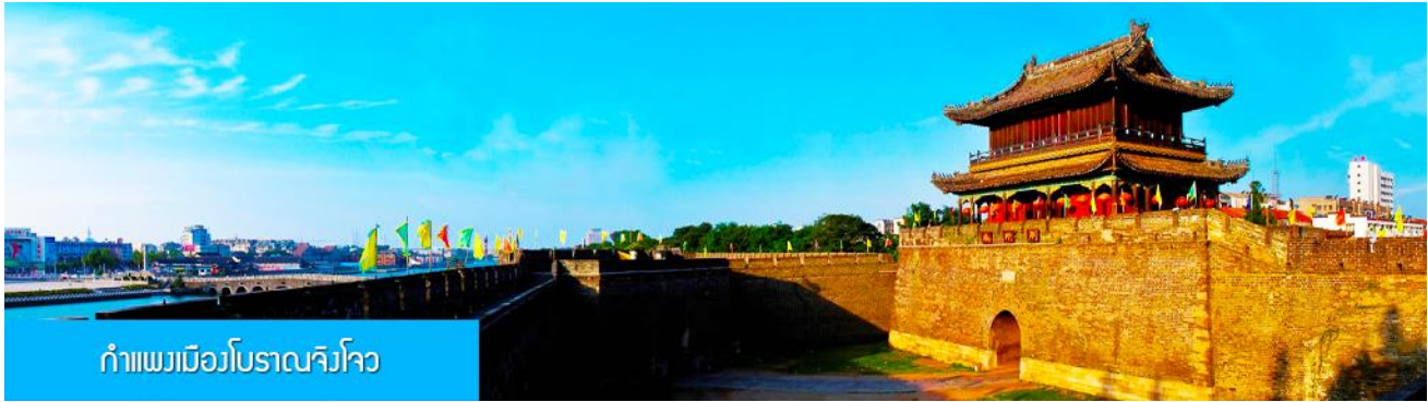
กำแพงเมืองโบราณจิงโจว