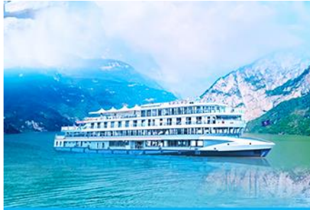
ล่องเรือชมเขื่อนสามผา