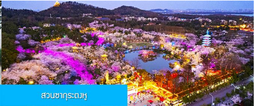
สวนซากุระตงหู