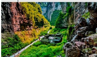
อุทยานแห่งชาติหลุมฟ้า 3 สะพานสวรรค์