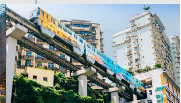
รถไฟฟ้าทะเลสาบ

*ทางบริษัทฯ ขอสงวนสิทธิ์ในการสลับโปรแกรมทัวร์ตามความเหมาะสมขึ้นอยู่กับสถานการณ์หน้างาน โดยคำนึงถึงผลประโยชน์ของลูกค้าเป็นสำคัญ