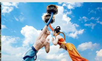
Wulong Flying Kiss