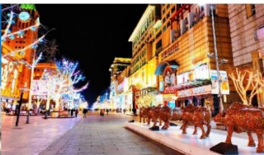
ถนนหวังฝูจิ้ง