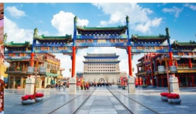
ถนนโบราณเจียนเหมิน