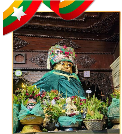
พามู “แม่ยักษ์” ตัดกรรม

พามู “แม่ยักษ์” คนพม่าเชื่อว่าแม่ยักษ์จะช่วยในการตัดกรรมจากเจ้ากรรมนายเวร ให้ชีวิตของคุณมีแต่ดีขึ้นเรื่อยๆ และยังช่วยเรื่องความมีชื่อเสียงโด่งดัง เป็นที่รู้จักในหน้าที่การงาน*