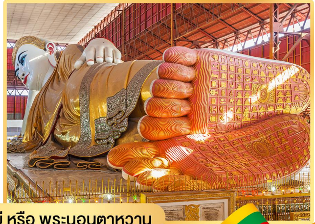
พระพุทธรไสยาสน์เจาทัตยี หรือ พระนอนตาทหวาน

นำท่านสักการะ พระพุทธรไสยาสน์เจ้าทัตยี (Kyauk Htatgyi Buddha) หรือ พระนอนตาทหวาน นมัสการพระพุทธรูปนอนที่มีความยาว 55 ฟุต สูง 16 ฟุต ซึ่งเป็นพระที่มีความสวยที่สุดมีขนตาที่งดงาม พระบาทมีภาพมงคล 108 ประการ และพระบาทซ้อนกันซึ่งแตกต่างกับศิลปะของไทย