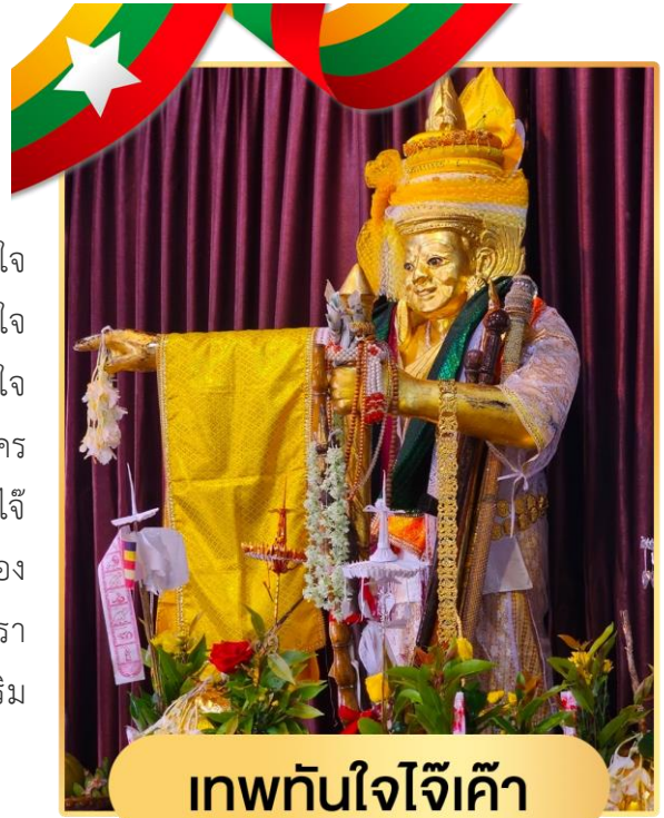
เทพทันใจใจเค้า

นำท่านเดินทางไปยัง เจดีย์ที่เก่าแก่อีกแห่งหนึ่งของพม่า เจดีย์ใจเค้า (Kyaik Khauk Pagoda) ถือได้ว่าเป็นเจดีย์คู่บ้านคู่เมืองของสิเรียม และยังมีเทพทันใจไว้เข้าซึ่งบอกเลยว่าองค์นี้แหละค่ะคือหัวหน้าเทพทันใจในอย่างกึ่งอย่างแท้จริง เพราะที่การจะสร้างเทพทันใจขึ้นมาใหม่นั้นจะต้องมาบวงสรวงขออนุญาตที่นี่ก่อน ใครที่อยากได้งานใหญ่ เงินเยอะ ให้มาสักการะเทพทันใจไว้เข้าแห่งนี้ ทั้งชาวพม่าและชาวไทยจึงมาไหว้ขอพรเรื่องงานและความสำเร็จกันมากมาย โดยเฉพาะเหล่าดาราชื่อดังของไทยที่นิยมไปกราบไหว้เสริมสิริมงคลเสริมชื่อเสียงบารมีกันอย่างล้นหลาม