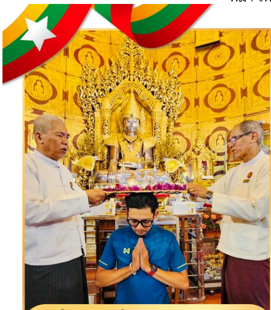
ร่วมพิธีเทินพระธาตุ ณ เจดีย์กาบาเอ

นำท่านสักการะ พระเจดีย์กาบาเอ เป็นเจดีย์ทรงกลม มีทางเข้าทั้งหมดห้าด้าน ทุกด้านจะมีพระพุทธรูปประดิษฐานอยู่บนฐานทักษิณ มีพระพุทธรูปหุ้มด้วยทองคำ องค์เล็กๆอีก 28 องค์ แทนอดีตสาวกของพระพุทธรเจ้า ทั้ง 28 องค์ มีความสูง และเส้นผ่าน ศูนย์กลางคือ 34 เมตร สร้างโดยนายอนุญายกคนแรก ของพม่า เพื่อใช้เป็นสถานที่สังคายนาพระไตรปิฎก ในปี ค.ศ. 1954 – 1956 และอุทิศพระเจดีย์องค์นี้เพื่อให้เกิดการสร้าง สันติภาพขึ้นในโลก ภายในองค์พระเจดีย์บรรจุ พระบรมธาตุ มีพระอรหันต์สาวกองค์ สำคัญ สององค์ มีพระพุทธรูปองค์พระประธาน ที่อยู่ข้างในหล่อด้วยเงินบริสุทธิ์มีน้ำหนักกว่า 500 กิโลกรัม