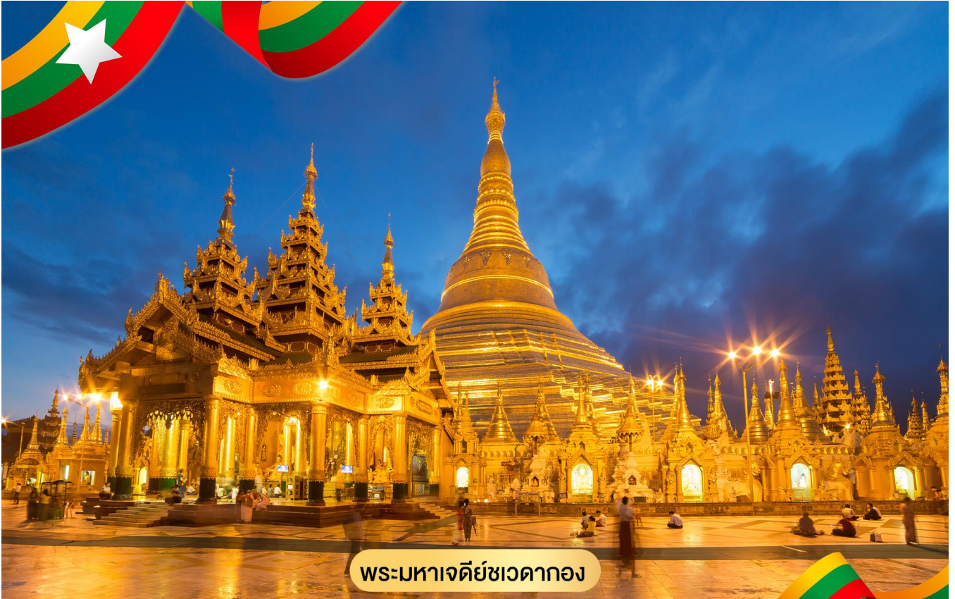
พระมหาเจดีย์ชเวดากอง

ระฆังศักดิ์สิทธิ์ ให้ตีระฆัง 3 ครั้งแล้วอธิษฐานขออะไรก็ได้ดังต้องการ จากนั้นให้ท่านชมแสงของอัญมณีที่ประดับบนยอดฉัตรโดยจุดชมแต่ละจุดท่านจะได้เห็นแสงสีต่างกันไป เช่น สีเหลือง, สีน้ำเงิน, สีส้ม, สีแดง เป็นต้น