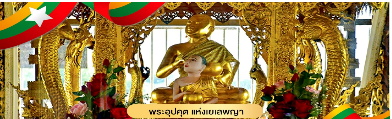
พระอุคุต แห่งเยเลพญา

นอกจากนี้ผู้คนนิยมมาสักการะ พระอุคุต โดยคนที่นี่มีความเชื่อกันว่า พระอุคุตจะบันดาลให้มีกินมีใช้ และมีโชคลาภ ซึ่งวิหารของพระอุคุตจะอยู่ด้านหลังองค์เจดีย์ ถูกสร้างยื่นออกมาจากเกาะเล็กน้อย และถัดไปไม่กี่กิโลนักจะมีเทพน้ำจืด-น้ำเค็ม ส่วนใหญ่ผู้คนที่มากราบไหว้เทพทั้งสององค์นี้มักจะขอพรในเรื่องของธุรกิจการค้าและเมื่อเราเข้าไปชมความงดงามภายในเจดีย์ และไหว้พระขอพรเสร็จเรียบร้อยแล้ว