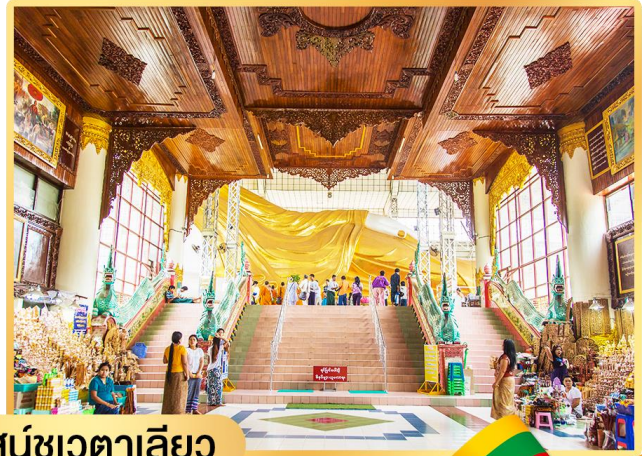
พระพุทธไสยาสน์ชเวตาลีเยว