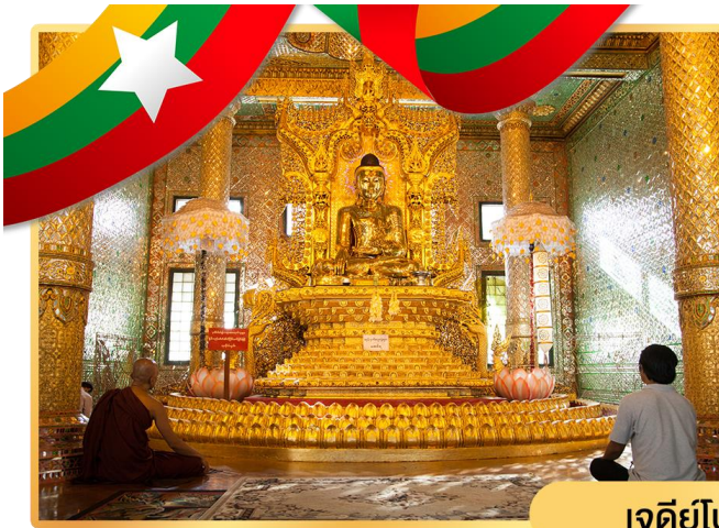
เจดีย์โบตาทาว์