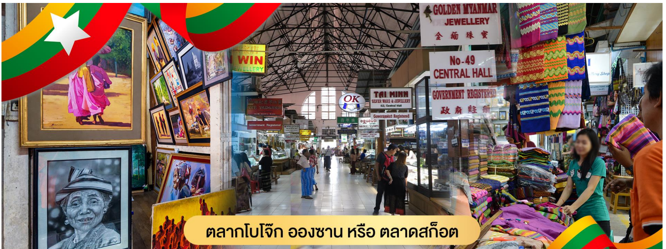
ตลาดโบโจ๊ก อองซาน หรือ ตลาดสก๊อต

นำท่านสักการะ พระพุทธรไสยาสน์เจ้าทัตยี (Kyauk Htatgyi Buddha) หรือ พระนอนตาทหวาน นมัสการพระพุทธรูปนอนที่มีความยาว 55 ฟุต สูง 16 ฟุต ซึ่งเป็นพระที่มีความสวยที่สุดมีขนตาที่งดงาม พระบาทมีภาพมงคล 108 ประการ และพระบาทซ้อนกันซึ่งแตกต่างกับศิลปะของไทย