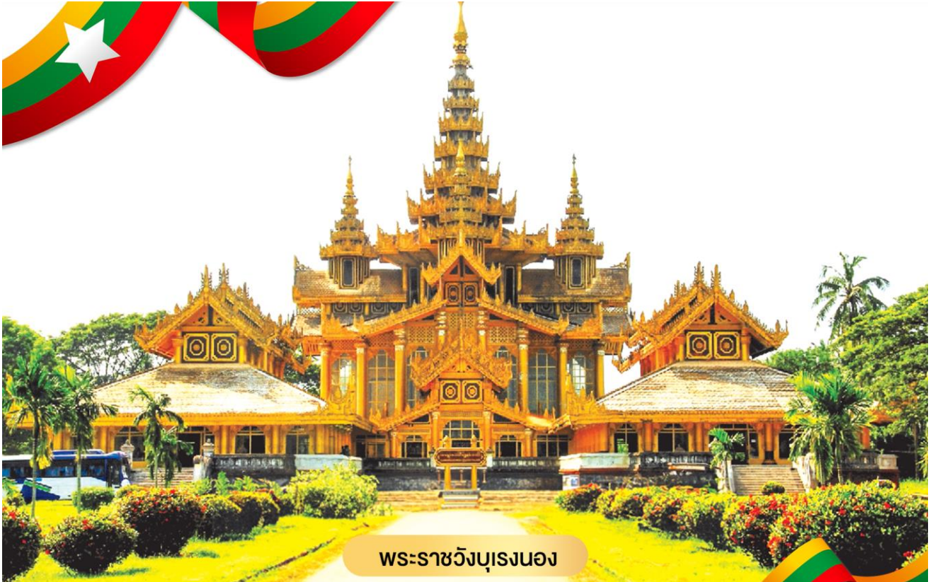
พระราชวังบุเรงนอง

ศิลปะพม่าและศิลปะของมอญได้อย่างกลมกลืน พระเจดีย์สูง 377 ฟุต สูงกว่า พระเจดีย์ชเวดากอง 51 ฟุต มีจุดอธิษฐานที่ศักดิ์สิทธิ์อยู่ ตรงบริเวณยอดฉัตร ที่ตกลงมาเมื่อปี พ.ศ. 2473 ด้วยน้ำหนักที่มหาศาล ตกลงมายังพื้นล่างแต่ยอดฉัตร กลับยังคงสภาพเดิมและไม่แตกกระจายออกไป เป็นที่รำลือถึงความศักดิ์-สิทธิ์โดยแท้ และสถานที่แห่งนี้ยังเป็นสถานที่ที่พระเจ้าหงสาวดีนันทบุเรง ใช้เป็นที่เฝ้าพระกรรม (หู) ตามพระราชประเพณีโบราณ เพื่อทดสอบความกล้าหาญก่อนขึ้นครองราชย์ ท่านจะได้สิริมงคล ซึ่งเปรียบเหมือนดั่งคำจูนชีวิตให้เจริญรุ่งเรืองยิ่งขึ้นไป