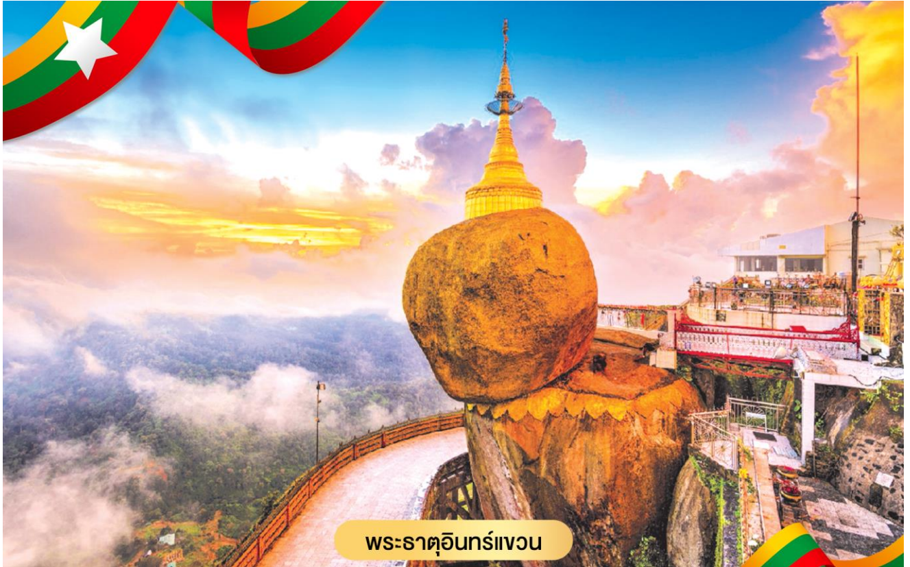
พระธาตุนิรันดรเขวน

ทัพ กลับกรุงหงสาวดี พระแสงปืนที่ใช้ยิงสุรกรรมาตายนบนคอช้างนี้ได้นามปรากฏต่อมาว่า "พระแสงปืนต้นข้ามแม่น้ำสะโตง" นับเป็นพระแสง อัญญาวุธ อันเป็นเครื่องราชูปโภค ยังปรากฏอยู่จนถึงทุกวันนี้