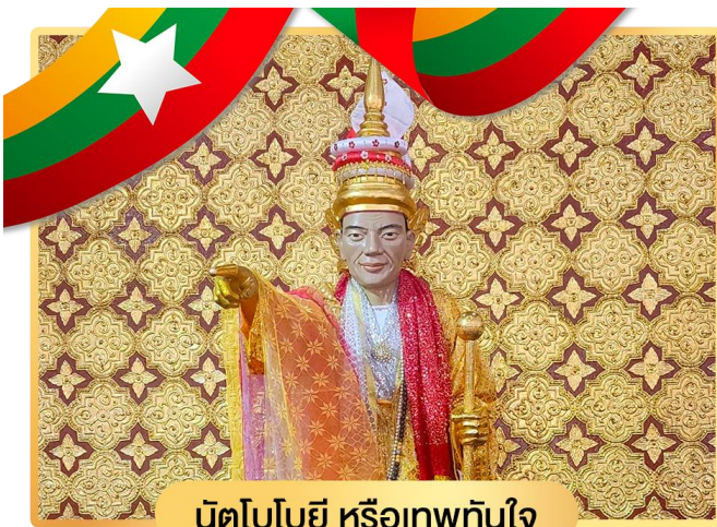
นัตโบโบยี หรือเทพทันใจ

จากนั้นนำท่านข้ามฝั่งไปอีกปากหนึ่งของถนน เพื่อสักการะ เทพกระซิบ ซึ่งมีนามว่า “อะมาดอร์เมียะ” ตามตำนานกล่าวว่า นางเป็นธิดาของพญานาค ที่เกิดศรัทธาในพุทธศาสนาอย่างแรงกล้า รักษาศีล ไม่ยอมกินเนื้อสัตว์จนเมื่อสิ้นชีวิตไปกลายเป็นนัต ซึ่งชาวมอและเคารพกราบไหว้กันมานานแล้ว ซึ่งการขอพรเทพกระซิบต้องไปกระซิบเบาๆ ห้ามคนอื่นได้ยิน ชาวมอและนิยมขอพรจากเทพองค์นี้กันมากเช่นกัน การบูชาเทพกระซิบบูชาด้วยน้ำนม ข้าวตอก ดอกไม้ และผลไม้