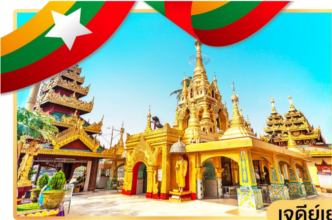
เจดีย์เยเลพญา

จากนั้นนำท่านเดินทางโดยรถโค้ชสู่ เมืองลิเรียม ซึ่งอยู่ห่างจากกรุงย่างกุ้งประมาณ 45 กิโลเมตร เมื่อเดินทางถึงเมืองลิเรียม ชมความงามแปลกตา ของเมือง ซึ่งเมืองนี้เคยเป็นเมืองท่าของโปรตุเกสในสมัยโบราณ ตั้งแต่ในสมัย นายพล ฟิลิป เดอ บริโต ยี นิโคเต จนมาสิ้นสุดเมื่อปี พ.ศ 2156 ร่วมสมัยพระเจ้าทรงธรรมกรุงศรีอยุธยา ท่านจะเห็นเศษซาก กำแพง สไตลลูชิตาเนียนบาโรก ตั้งอยู่ริมฝั่งแม่น้ำย่างกุ้งเชื่อมกับแม่น้ำอิรวดี