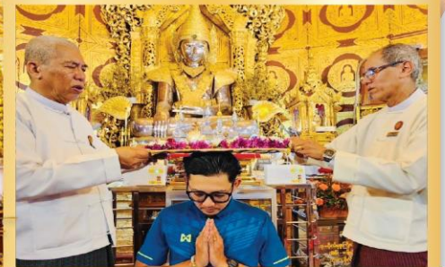
ร่วมพิธีเก็บพระธาตุนิรันดรเขวน