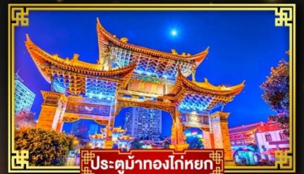
ประตูม้าทองใต้หยก