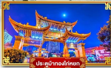
ประตูม้าทองโก่หยก