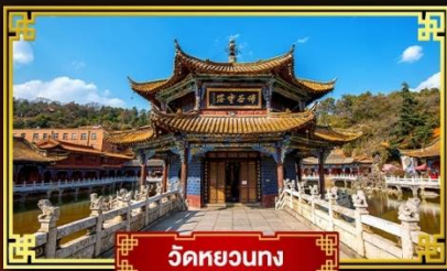
วัดหยวนกง

นั่งกระเช้าขึ้นสู่อยอดภูเขาหิมะเจี๋ยจื่อ