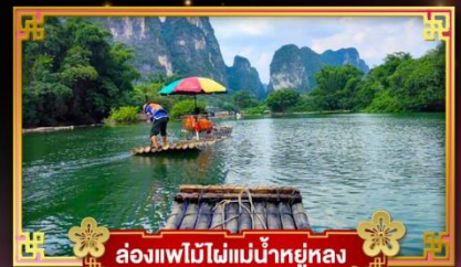
ล่องแพไม้ไผ่แม่น้ำหยูหลง