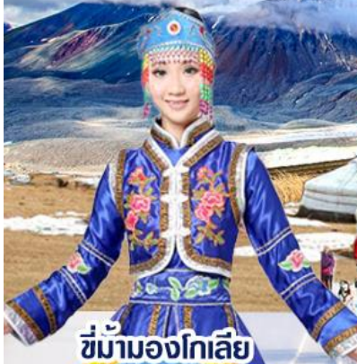
ซึ่ม้ามองโกเลีย