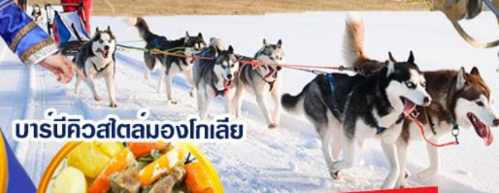
บาร์บีคิวสเตอ์มองโกเลีย