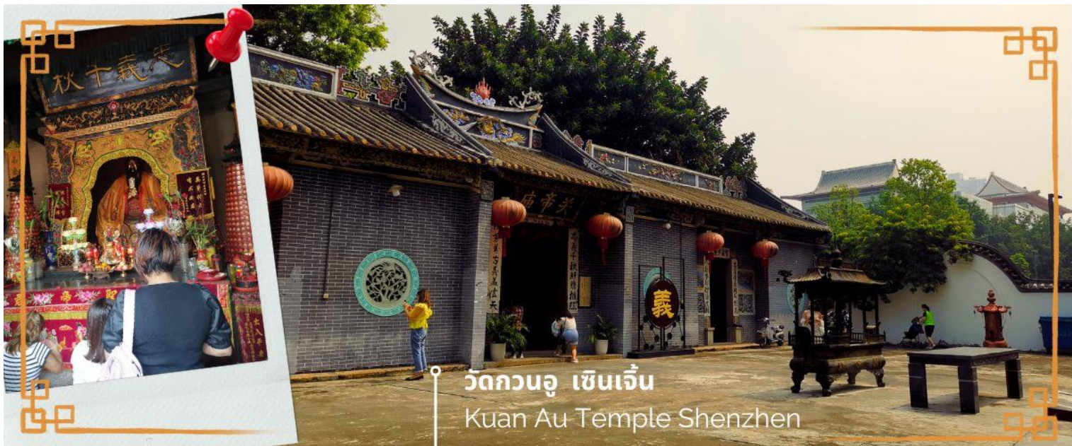
วัดกวนอู เฉินเจิ้น

จากนั้นนำท่านเดินทางสู่ วัดกวนอู ไหว้เทพเจ้ากวนอู สัญลักษณ์ของความซื่อสัตย์ ความกตัญญูรู้คุณ ความจงรักภักดี ความกล้าหาญ โขคลาก และบารมี ท่านเปรียบเสมือนตัวแทนของความเข้มแข็งเด็ดเดี่ยวของอาจไม่ครั้นคร้ามต่อศัตรู ท่านเป็นคนจิตใจมั่นคงตั้งขุนเขา มีสติปัญญาเฉลียวฉลาด และไม่เคยประมาทการบูชาขอพรท่านก็