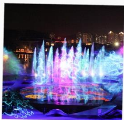
โชว์น้ำสามมิติ OCT BAY WATER SHOW