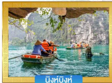
นิงห์บิงห์