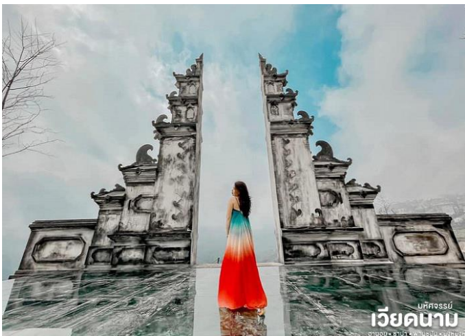
มหัสจรรย์ เวียดนาม ฮานอย • ซาปา • ฟานซิปัน • นิงห์ฮิงห์