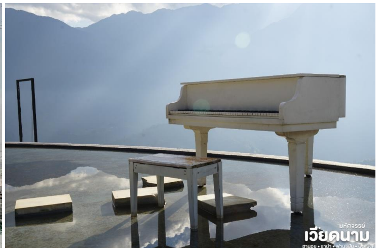
มหัสจรรย์ เวียดนาม ฮานอย • ซาปา • ฟานซิปัน • นิงห์ฮิงห์