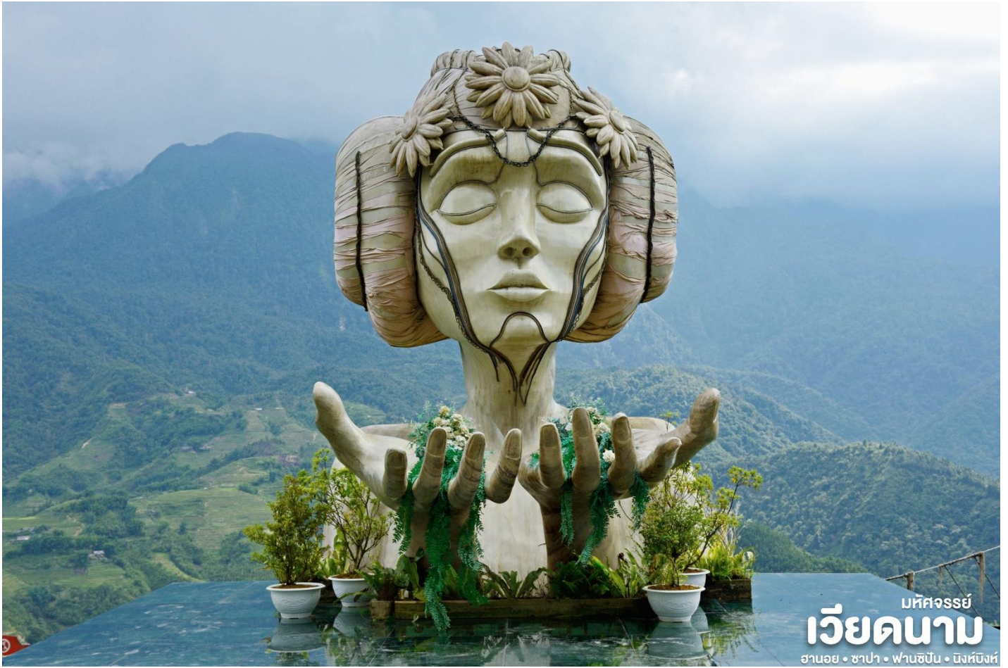
มหัสจรรย์ เวียดนาม ฮานอย • ซาปา • ฟานซิปัน • นิงห์ฮิงห์