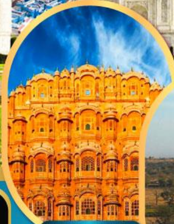
พระราชวัง สายลม

18-23, 25-30 ม.ค.68 01-06, 07-12, 15-20, 22-27 ก.พ.68 05-10, 12-17, 19-24 มี.ค.68 21-26, 26-31 มี.ค.68 28 มี.ค.-02 เม.ย.68