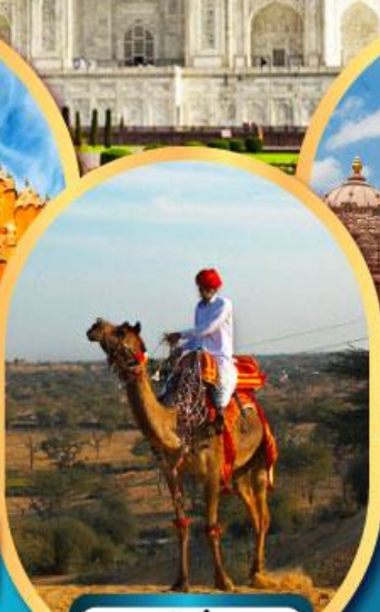
ฟรี ขี่อูฐ เมืองมันทวา