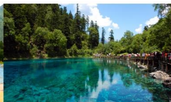
อุทยานแห่งชาติจิวจ้ายโกว