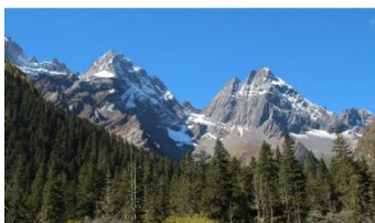
ภูเขาสี่ดรุณี