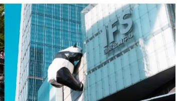
แพนด้ายักษ์ปิ่นตึก IFS

*ทางบริษัทฯ ขอสงวนสิทธิ์ในการสลับโปรแกรมทัวร์ตามความเหมาะสมขึ้นอยู่กับสถานการณ์หน้างาน โดยคำนึงถึงผลประโยชน์ของลูกค้าเป็นสำคัญ