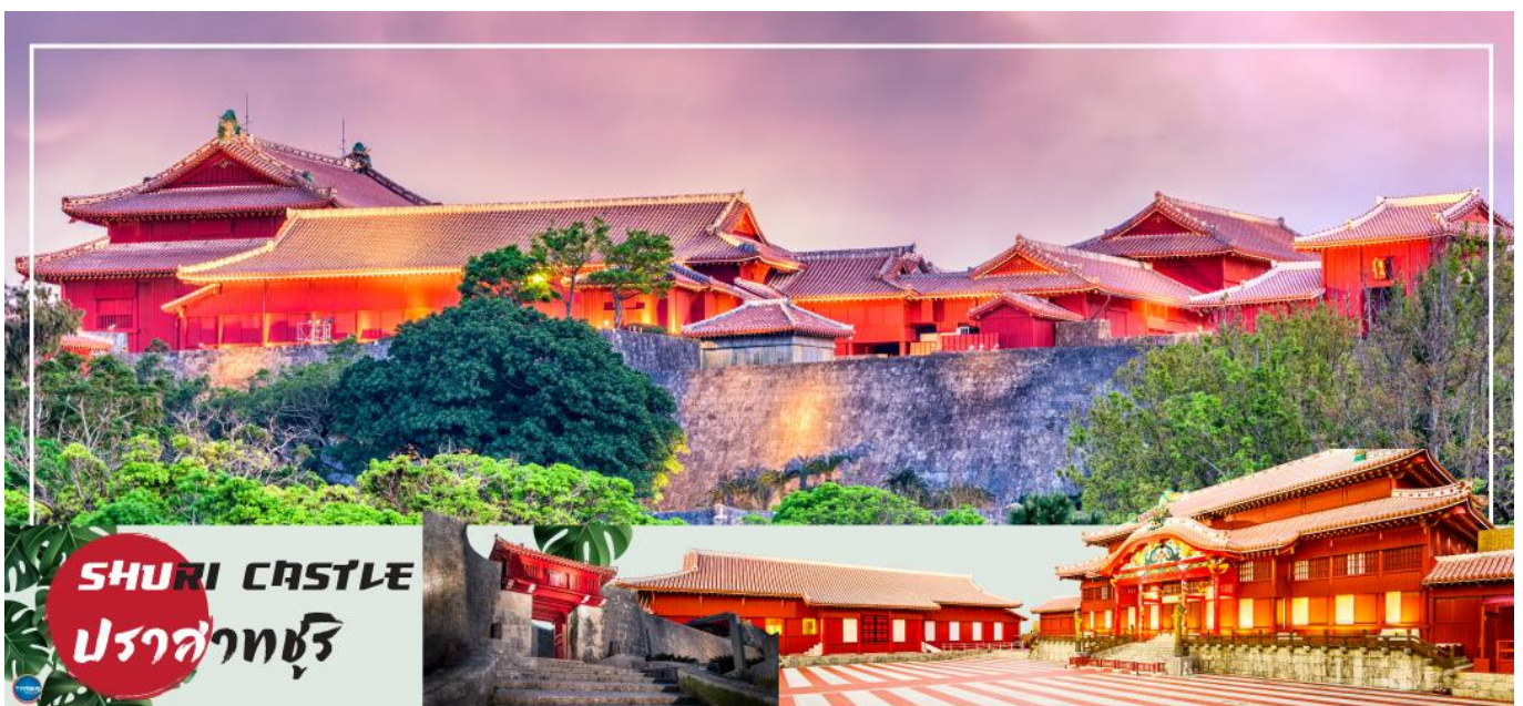
SHURI CASTLE ปราสาทชुरิ

วันที่สาม ปราสาทชुरิ (ด้านนอก) - ดิวตี้ฟรี - โอกินาว่าเวิลด์ - ถ้ำธรรมชาติเกียวคุเซ็นโด - โรงงานแก้ว - ศูนย์การค้าอุมิคะจิ เทอเรส