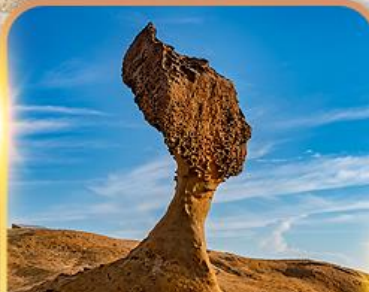
อุทยานเหยหลิว