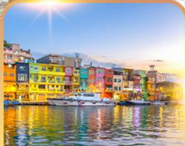
ท่าเรือตึกหลากสี