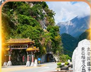
อุทยานทาโรโกะ(ด้านหน้า)