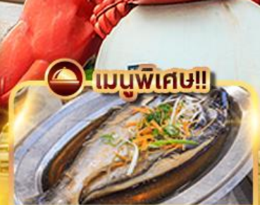
ปลาประรานาธิบดี