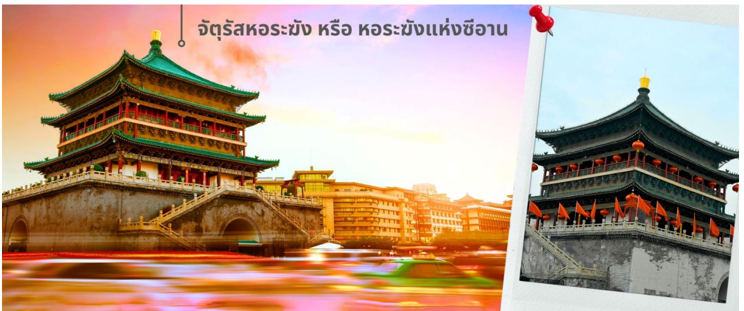
จัตุรัสหอรမ်း หรือ หอรမ်းแห่งซีอาน

จากนั้นนำท่านเดินทางเที่ยวชม จัตุรัสหอรမ်း หรือ หอรမ်းแห่งซีอาน เป็นหนึ่งในสัญลักษณ์สำคัญของเมืองซีอาน ตั้งอยู่ใจกลางเมือง สร้างขึ้นในปี ค.ศ. 1384 สมัยราชวงศ์หมิง เพื่อใช้ประกาศเวลาและเตือนภัยจากศัตรู ตัวหอสร้างจากไม้ทั้งหลัง มีความสูงประมาณ 36 เมตร โดดเด่นด้วยสถาปัตยกรรมจีนโบราณที่งดงาม และการประดับด้วยลวดลายสีทองและเขียว จัตุรัสแห่งนี้เป็นจุดตัดของถนนสายหลักทั้งสี่สายสามารถขึ้นไปชมวิวเมืองซีอานแบบพาโนรามาได้ด้านบน นอกจากนี้ ภายในยังมีนิทรรศการเกี่ยวกับประวัติศาสตร์และวัฒนธรรมของหอรမ်းให้ได้ชมอีกด้วย