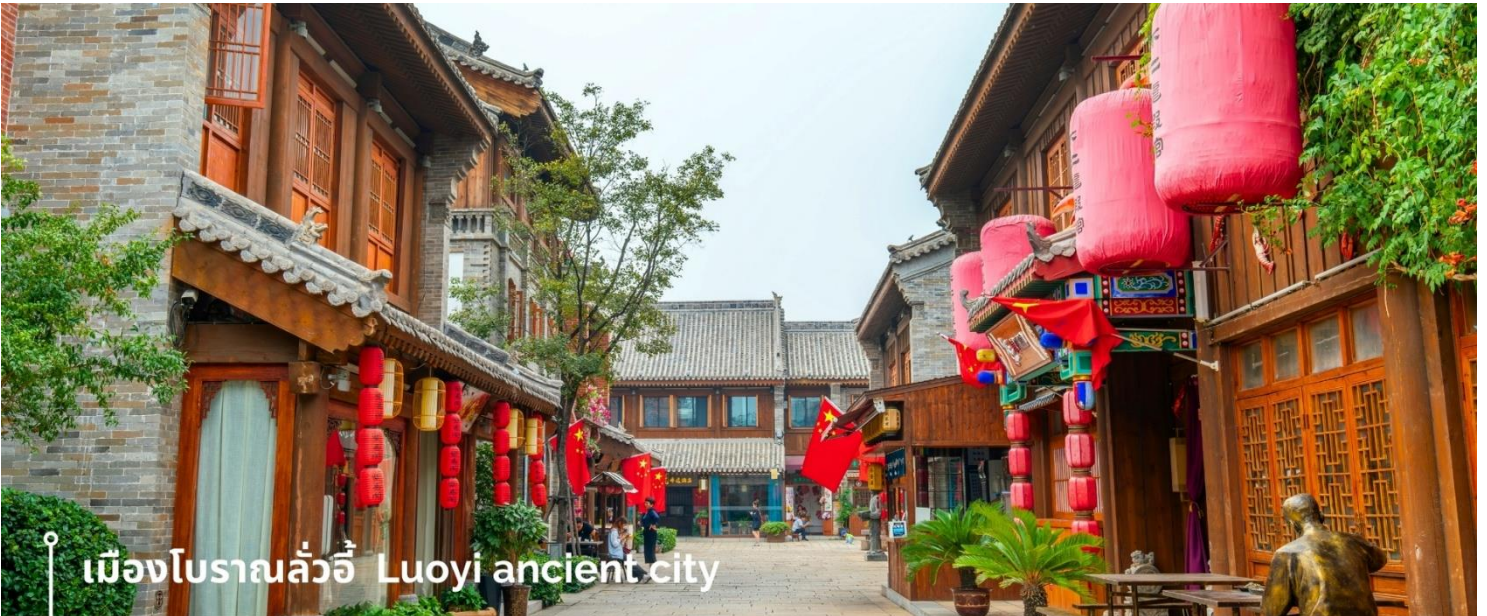
เมืองโบราณลั่วอี้ Luoyi ancient city

นำท่านเที่ยวชม เมืองโบราณลั่วอี้ เป็นสถานที่ท่องเที่ยวระดับ 1A ตั้งอยู่ในเมืองเก่าของเมืองลั่วหยาง เมืองหลวงโบราณของราชวงศ์ทั้ง 13 ราชวงศ์ บรรยากาศอบอุ่นไปด้วยเสน่ห์แบบจีนโบราณ ที่ยังคงอยู่มายาวนานหลายร้อยปี เมื่อเดินเล่นผ่านเมืองโบราณลั่วอี้ จะเห็นสถาปัตยกรรมบ้านเรือน ที่มีขายคาซ้อนกันเป็นชั้นๆ และกำแพงเมือง สนามหญ้าโบราณ ให้ทุกท่านรู้สึกราวกับหลุดเข้าไปในยุคจีน โบราณ