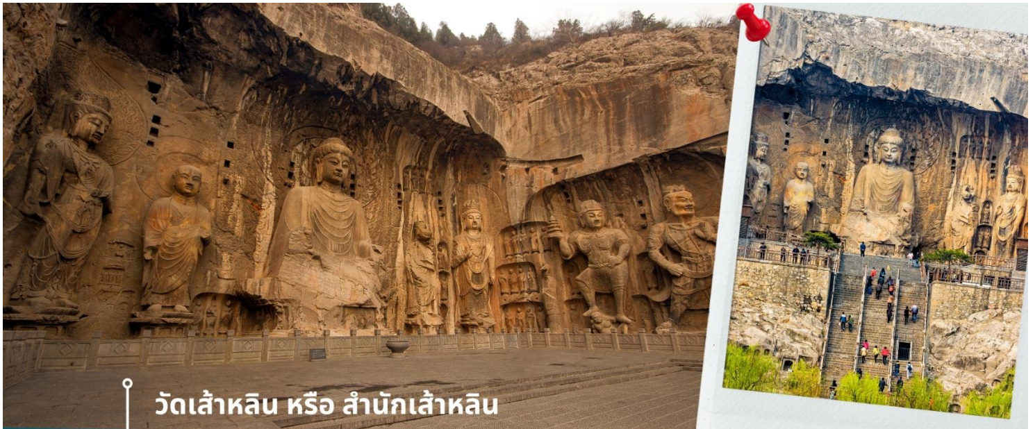
วัดเล้าหลิน หรือ สำนักเล้าหลิน

นำท่านชมความงามของ ถ้ำผาหินหลงเหมิน เป็นกลุ่มถ้ำมากกว่า 2,300 ถ้ำ มีแม่น้ำอู๋สือไหลผ่านตรงกลาง มองดูเสมือนประตูล้อมที่มีมังกรโผล่เล่นขนาบอยู่ จึงได้ชื่อว่าหลงเหมิน แปลว่า “ประตูมังกร” การแกะสลักศิวาจารย์กว่า 3,600 แผ่น รวมถึงรูปปั้นพระพุทธรูปอีกกว่า 100,000 รูป บนหน้าผาหินริมฝั่งแม่น้ำอู๋ ห่างจากเมืองลั่วหยางในมณฑลเหอหนาน ประเทศจีน ไปประมาณ 12 กิโลเมตร ถ้ำเหล่านี้เป็นหนึ่งในสามแหล่งปฏิมากรรมโบราณที่สำคัญที่สุดของจีน ซึ่งการแกะสลักสร้างขึ้นในช่วงระหว่างราชวงศ์เว่ยถึงราชวงศ์ถัง รวมระยะเวลากว่า 400 ปี โดยมีทั้งรูปปั้นเดี่ยว และภาพปูนสูง ที่แสดงถึงศิลปะและความเชื่อทางพุทธศาสนาในสมัยนั้น และยังพบการสกัดหินให้เป็นโพรงถ้ำถึง 1,352 โพรง ปัจจุบันถ้ำแห่งนี้ได้รับการขึ้นทะเบียนเป็นมรดกโลกทางด้านวัฒนธรรมโดยองค์การยูเนสโก และได้รับการยอมรับให้เป็นพิพิธภัณฑสถานขนาดใหญ่