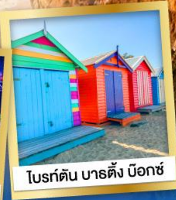
ไบรท์ตัน บาร์ตัง บ็อกซ์

03-10, 12-19 เม.ย.68 24 เม.ย.-01 พ.ค.68 08-15, 22-29 พ.ค.68 29 พ.ค.-05 มิ.ย.68