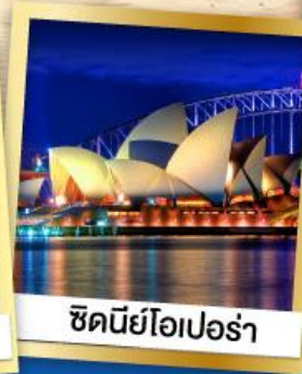
ซิดนีย์โอเปร่า