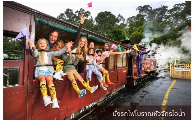
นั่งรถไฟโบราณหวัจกรอน้ำ