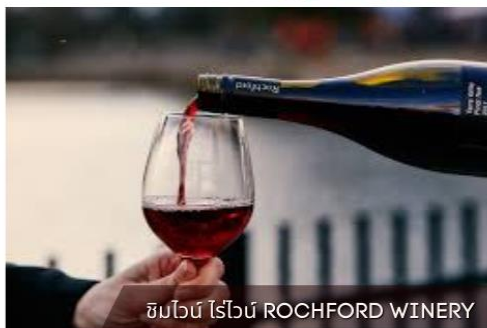
ชิมไวน์ ไรน์ ROCHFORD WINERY