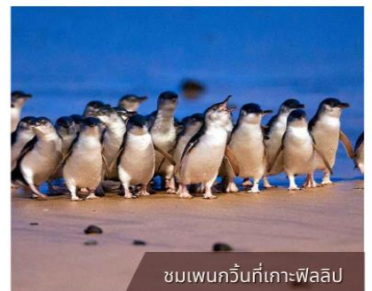
ชมเพนกวินที่เกาะฟาลิป