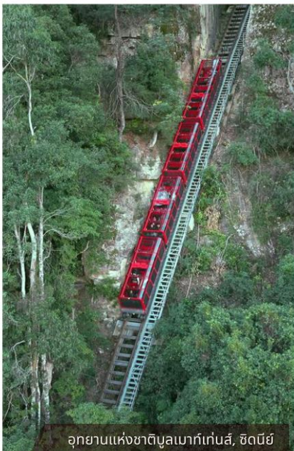
อุทยานแห่งชาติบูลแบกเก็นส์, ซิดนีย์