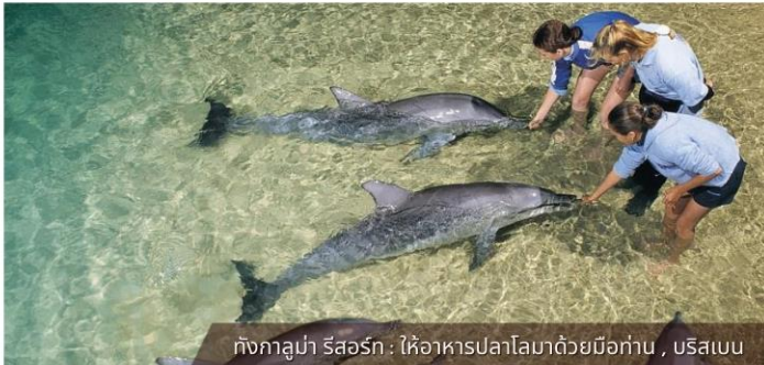
กังกาลูมา รัสออร์ก : ให้อาหารปลาโลมาด้วยมือท่าน , บริสเบน