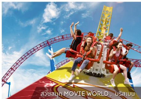
เล่นสนุก MOVIE WORLD , บริสเบน