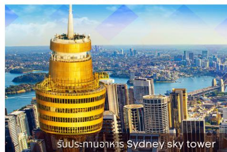
รับประทานอาหาร Sydney sky tower