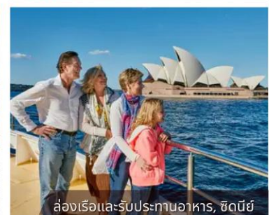
ล่องเรือและรับประทานอาหาร, ซิดนีย์