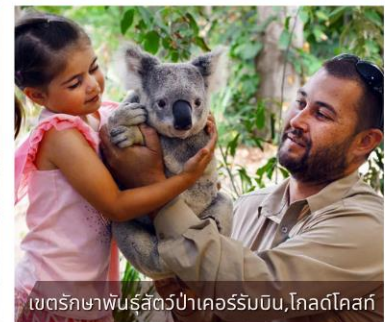
เขตรักษาพันธุ์สัตว์ป่าเคอร์รัมบีน, โกลด์โคสต์