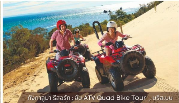
กังกาลูมา รัสออร์ก : ขับ ATV Quad Bike Tour , บริสเบน