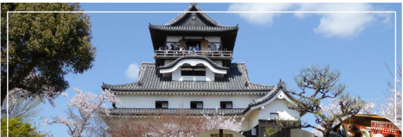
INUYAMA CASTLE ปราสาทอินูยามะ

วันที่สาม เมืองนาโกย่า - เมืองอินูยามะ - ปราสาทอินูยามะ(เข้าชม) (จุดชมซากุระขึ้นกับภูมิอากาศ) - ศาลเจ้าซังโคอินาริ - ย่านเมืองเก่าอินูยามะโจคามางิ - เมืองกิฟุ - หมู่บ้านมรดกโลกชิราคาวาโกะ - เมืองทาคายามะ - ออนเซ็น