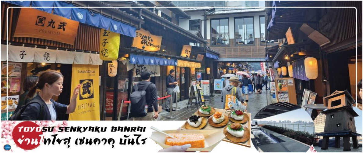
TOYOSU SENKYAKU BANRAI ย่านโทโยสุ เซนคาคู บันไร