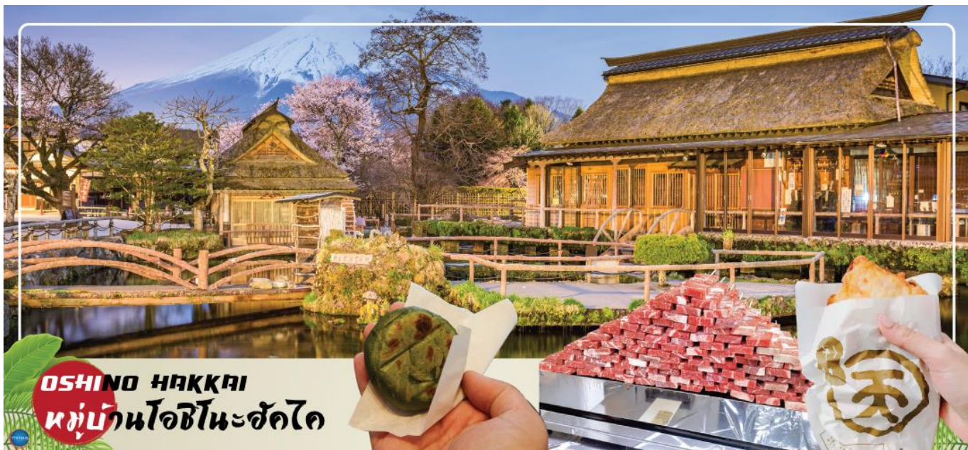
OSHINO HAKKAI หมู่บ้านโอชิโนะฮัคไค

ชาวญี่ปุ่นและนักท่องเที่ยวนิยมมาไหว้ขอพรเรื่องการทำงาน การเดินทางปลอดภัย และโชคลาภ บริเวณถนนเข้าสู่วัด เป็นถนนซอปปิงที่มีชื่อว่า โอมโตะซังโตะ นาริตะ (Naritasan Omotesando) หรือ ถนนปลาไหล ระยะทางประมาณ 1 กิโลเมตร จาสถานีรถไฟ เต็มไปด้วยร้านค้าต่างๆ เช่น ร้านจำหน่ายสินค้างานฝีมือดั้งเดิมร้านอาหารและร้านของที่ระลึกและที่ถนนแห่งนี้จะมีร้านขายข้าวหน้าปลาไหลขึ้นชื่อ และมีการแร่ปลาโชว์สดๆ หน้าร้านอีกด้วย ซึ่งเปิดบริการให้นักท่องเที่ยวมานานหลายศตวรรษ เที่ยง รับประทานอาหารกลางวัน ณ ภัตตาคาร (1)