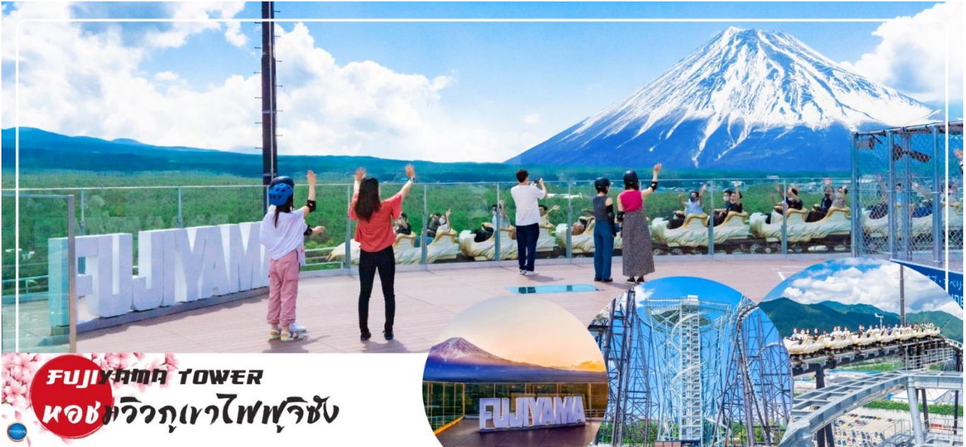
FUJIYAMA TOWER หอชมวิวภูเขาไฟฟูจิ

ได้เวลาอันสมควรนำท่านเดินทางสู่ เมืองนาริตะ (Narita) (ใช้เวลาเดินทางประมาณ 2.30 ชั่วโมง)