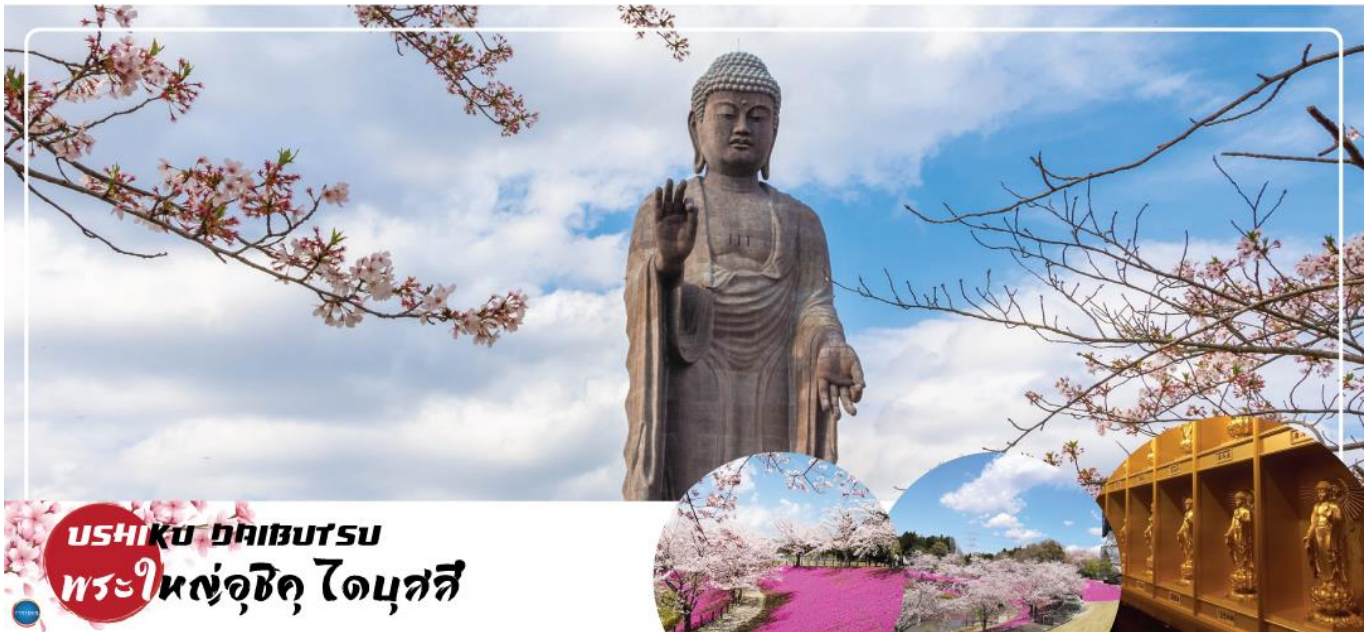
USHIKU DAIBUTSU พระใหญ่อุซึกุ ไดบุตสึ

22.30 น. พร้อมกันที่ ทำอากาศยานนานาชาติ ดอนเมือง อาคาร 1 ชั้น3 ประตู8 ผู้โดยสารขาออกระหว่างประเทศ เคาน์เตอร์ สายการบินแอร์เอเชีย เอ็กซ์ เจ้าหน้าที่ของบริษัทฯ คอยให้การต้อนรับ และอำนวยความสะดวกในการเช็คอิน