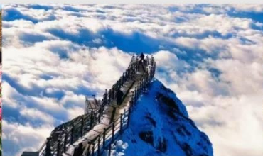
ภูเขาหิมะเจี๋ยจื่อ