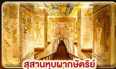
สุสานหุบผากษัตริย์