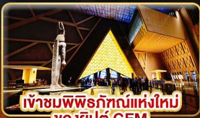
เข้าชมพิพิธภัณฑ์แห่งใหม่ ของอียิปต์ GEM