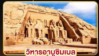
วิหารอาบูซิมเบล