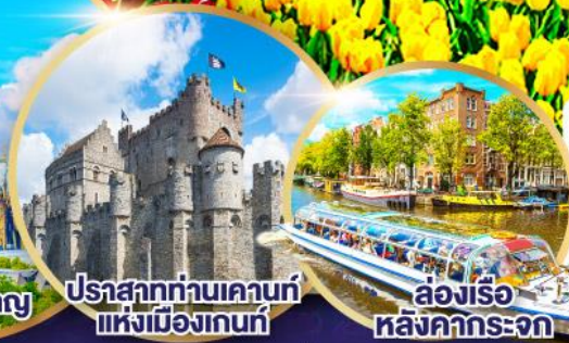
ปราสาทท่านเคานท์แห่งเมืองเกนท์