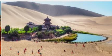
สระน้ำวงพระจันทร์