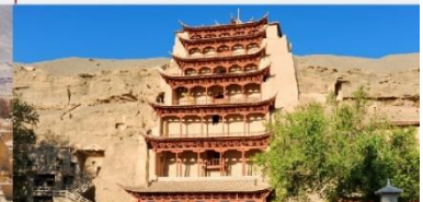
ชมถ้ำหินมั่วเกาคู