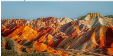
หุบเขาสายรุ้งจางเย่