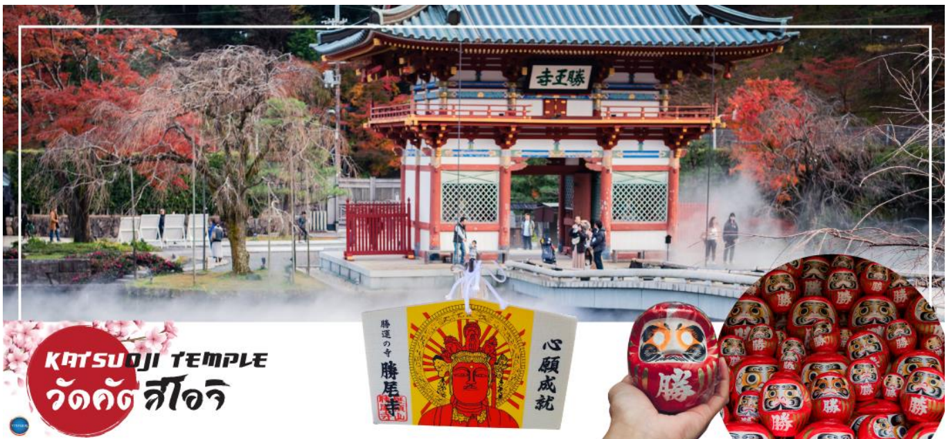
KATSUOJI TEMPLE วัดคัตสึโอจิ

จากนั้นสัมผัสวัฒนธรรมดั้งเดิมของชาวญี่ปุ่น นั่นก็คือ การเรียนรู้ชงชาญี่ปุ่น (Japanese tea ceremony หรือภาษาญี่ปุ่นเรียกว่า Sado) โดยการชงชาตามแบบญี่ปุ่นนั้น มีขั้นตอนมากมาย เริ่มตั้งแต่การชงชา การรับชา และการดื่มชา ทุกขั้นตอนนั้นล้วนมีพิธี รายละเอียดที่บรรจงและสวยงามเป็นอย่างมาก พิธีชงชาไม่ใช่แค่รับชมอย่างเดียว ยังเปิดโอกาสให้ท่านได้มีส่วนร่วมในพิธีการชงชานี้อีกด้วย