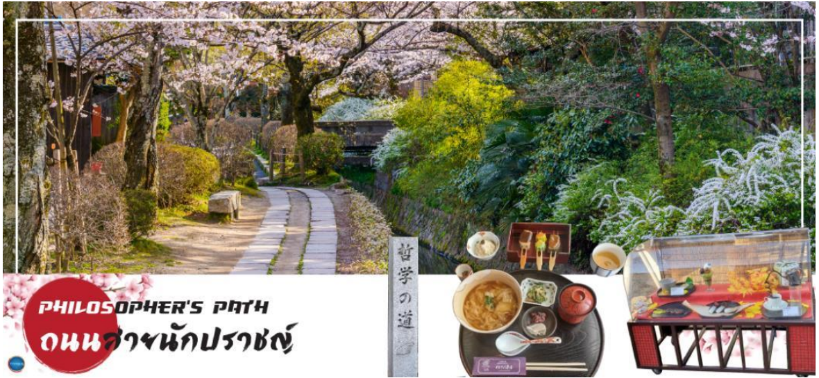
PHILOSOPHER'S PATH ถนนสำนักปราชญ์

ซากุระประมาณ 500 ต้น จึงเป็นจุดชมซากุระยอดนิยมในช่วงกลางเดือนมีนาคมถึงช่วงต้นเดือนเมษายน ล (ขึ้นอยู่กับภูมิอากาศ) และที่แห่งนี้ก็ยังมีร้านขายของและคาเฟ่น่ารักๆ กับน้องแมวที่อาจจะโผล่มาให้ท่านได้ถ่ายรูปอีกด้วย