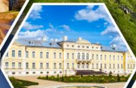
พระราชวังรินดาเล