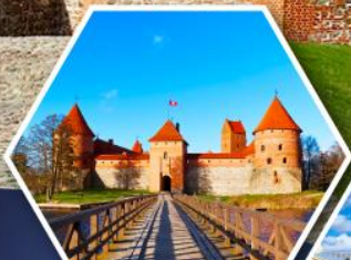
ปราสาทกราด