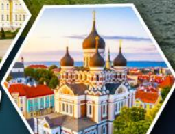
วิหารอเล็กซานเดอร์ เนฟสกี (ทาลลินน์)