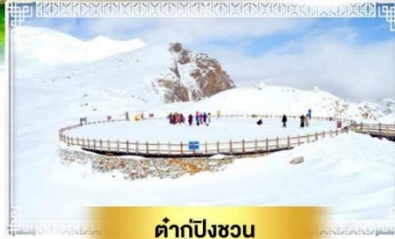
ต้ากู่ปิงชว่น