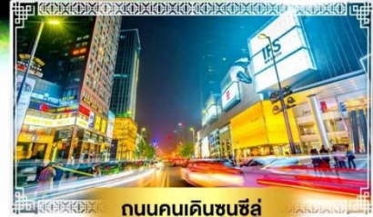
ถนนคนเดินชุนซีลู่