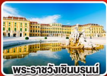
พระราชวังซินบรุณี