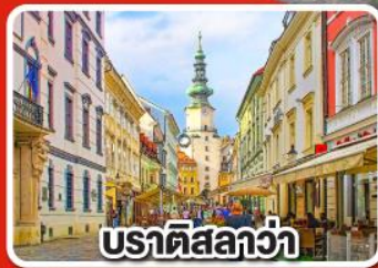
ปราติสลาวา

เที่ยวเมือง คาร์โลวารี เมืองแห่งสปา พร้อมเมนูพิเศษเปิดโบฮีเมีย