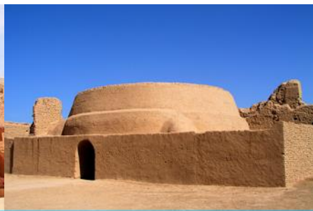
เมืองโบราณเกาซางกู่เจิง