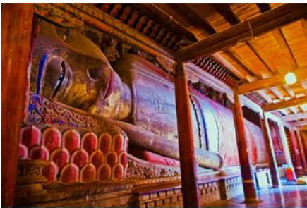
วัดพระใหญ่

พักที่ SI LU QIAN XI HOTEL โรงแรมระดับ 4 ดาวท้องถิ่น หรือเทียบเท่าในเมืองจางเยี่ยน