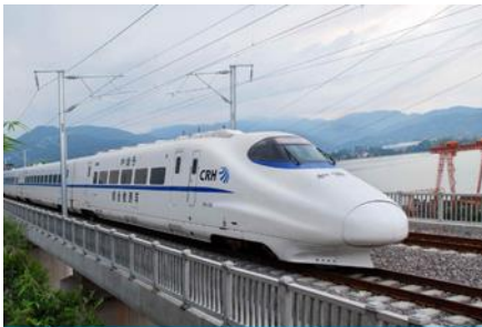
นิทรรศน์ไฟความเร็วสูง