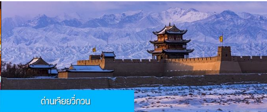
ด่านเจียยวี่กวน