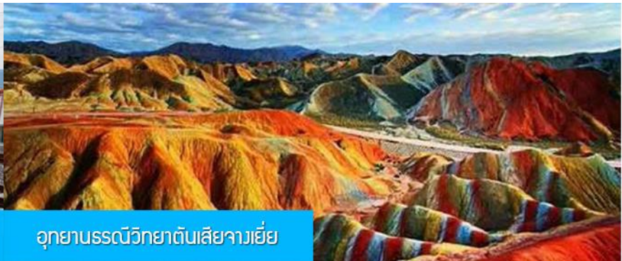
อุทยานธรณีวิทยาต้นเสียวเจียงเยี่ย

วันที่สอง เมืองหลันโจว – นิทรรศน์ไฟความเร็วสูงสู่เมืองจางเยี่ย – เที่ยวชมอุทยานธรณีวิทยาต้นเสียว(ภูเขาสายรุ้ง)