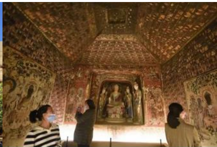
ชมภาพยนตร์ 3 มิติ