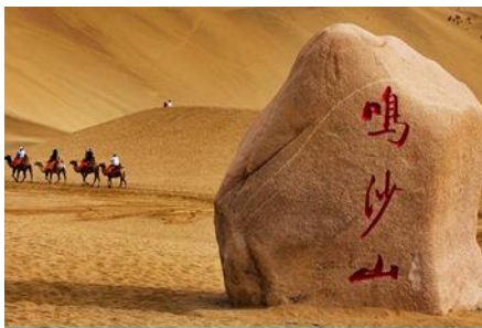
เนินทรายหมิงซาซาน

หลังอาหารให้ท่าน มีเวลาเดินเล่น ช้อปปิ้งใน ตลาดกลางคืน ซาโจว 沙洲夜市 ให้ท่านเลือกซื้อของที่ระลึกของเส้นทางสายไหมได้ตามอัธยาศัย