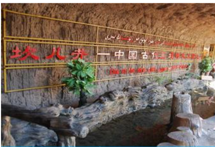
ระบบชลประทานอู่หลู่ฟาน

พักที่ HAMPTON BY HILTON HOTEL โรงแรมระดับ 4 ดาวหรือเทียบเท่าในเมืองอู่หลู่ฟาน