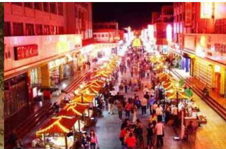
ตลาดกลางคืน ซาโจว