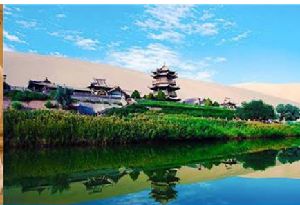
สระน้ำวงพระจันทร์