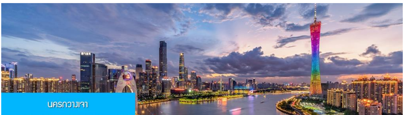
นครกวางเจา

วันแรก ท่าอากาศยานสุวรรณภูมิ – นครกวางเจา – เมืองหลันโจว