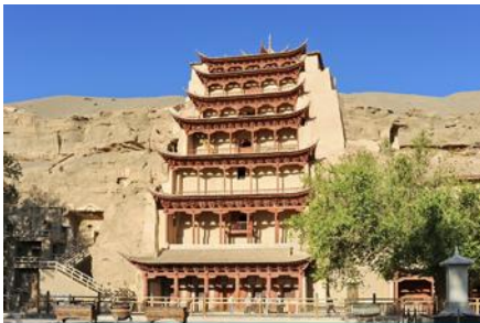
ถ้ำหินมั่วเกา

พักที่ REZEN HOTEL ระดับ 4 ดาวห้องดีหรือเทียบเท่าในเมือง เจียยวี่กวน