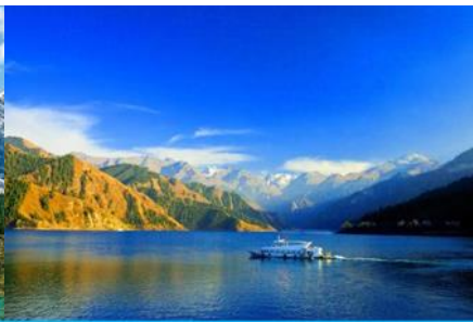
ล่องเรือทะเลสาบเทียนฉือ