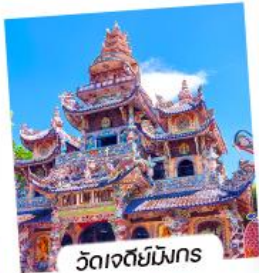
วัดเจดีย์มังกร