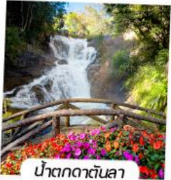
น้ำตกดาตันลา