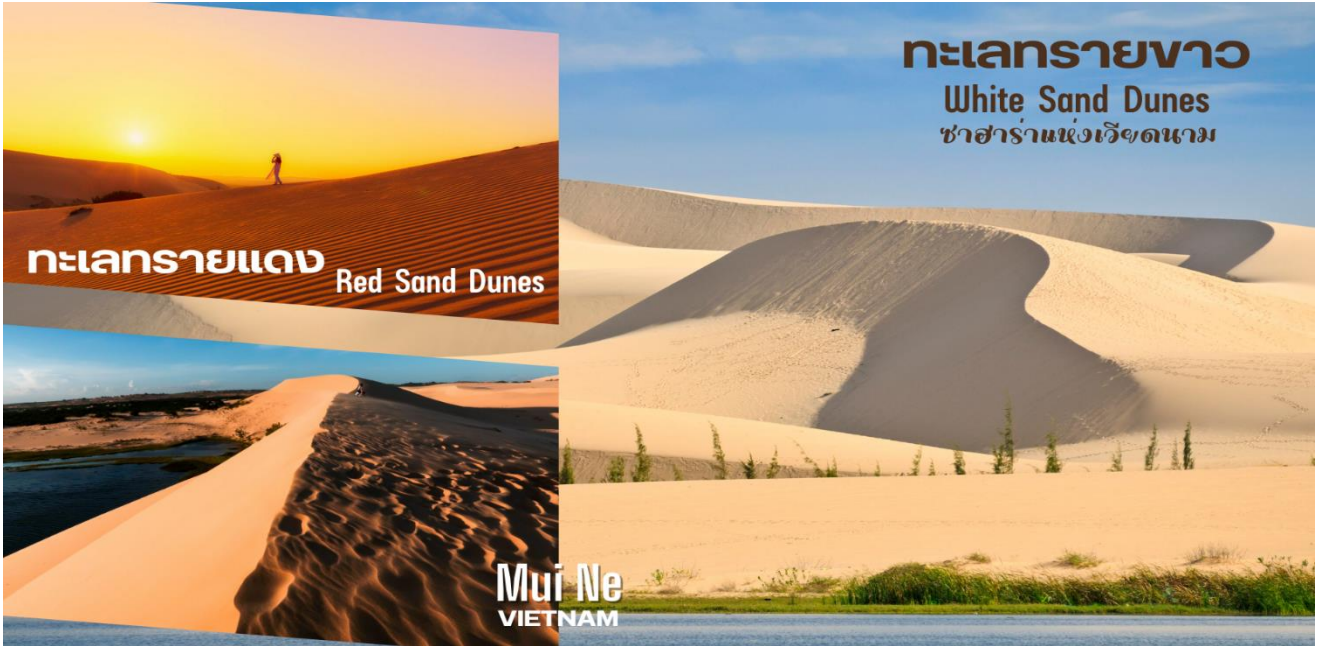
ทะเลทรายแดง Red Sand Dunes