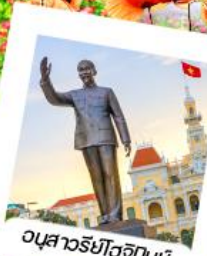
อนุสาวรีย์โฮจิมินห์