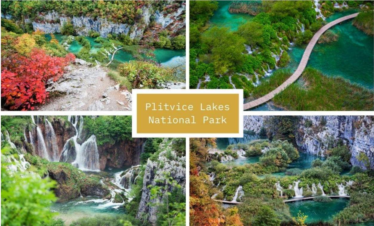
Plitvice Lakes National Park