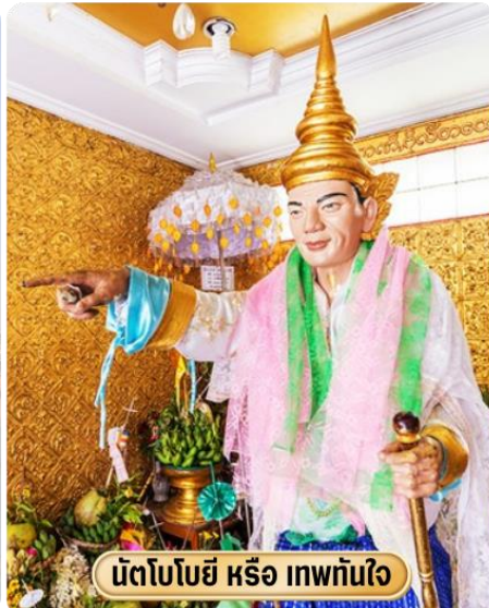
นัตโบโบยี หรือ เทพทันใจ