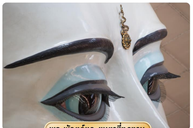
พระพักตร์และขนตาที่งดงาม