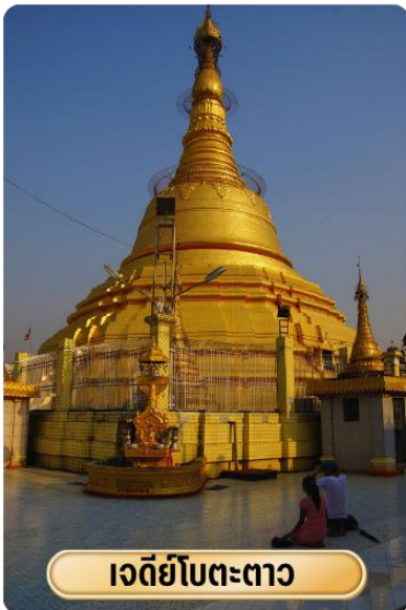
เจดีย์โบตตะตาว

นำท่าน เจดีย์โบตตะตาว หมายถึง “ทหาร1,000นาย” เจดีย์แห่งนี้เคยบรรจุพระเกศาธาตุของพระพุทธเจ้า ก่อนที่จะเจิญ ประดิษฐาน ณ เจดีย์ชเวดากอง ซึ่งถูกค้นพบ จากการที่ถูกระเบิดของฝ่ายสัมพันธมิตรลงกลางเจดีย์ ซึ่งภายในเจดีย์แห่งนี้สวยงามตกแต่งด้วยสีทองอร่าม ประดิษฐานพระพุทธรูปทองคำ ปางมารวิชัยที่สวยงาม ซึ่งจุดเด่นที่ทำให้วัดแห่งนี้เป็นที่รู้จักอย่างกว้างขวางคือ “รูปปั้นเทพทันใจ” หรือนัตโบโบยี เป็นที่สักการะยอดนิยม และเป็นทีนับถืออย่างมากของชาวมอญ และพม่าในอย่างกึ่ง เชื่อว่าหากอธิฐานขอพรสิ่งใดแล้วจะได้ตามขอ สมปรารถนาทันใจเลยทีเดียว สมควรแก่เวลานำท่านขอพรจาก “เทพกระซิบ” หรือ เม็ยะนานหน่วย ประทับอยู่ฝั่งตรงข้ามกับเจดีย์โบตตะตาว เทพกระซิบเป็นธิดาของพญานาคที่มีความศรัทธาต่อพระพุทธศาสนา เชื่อกันว่าถ้ากระซิบขออะไรแล้วจะสมหวัง