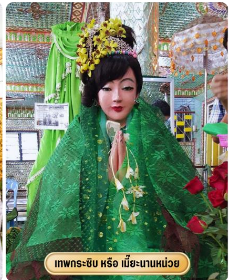
เทพกระซิบ หรือ เม็ยะนานหน่วย