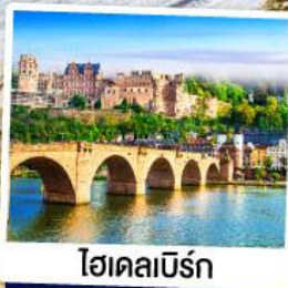
ไฮเดิลเบิร์ก