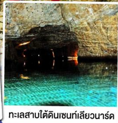
ทะเลสาบไ้ดินเซนท์เลียวนาร์ด

ล่องเรือชมทะเลสาบไ้ดินเซนท์เลียวนาร์ด ทะเลสาบไ้ดินลึกลับ สุดUnseenแห่งสวิตเซอร์แลนด์