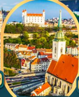
บราติสลาวา